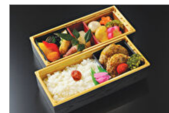
手ごねハンバーグ幕の内弁当