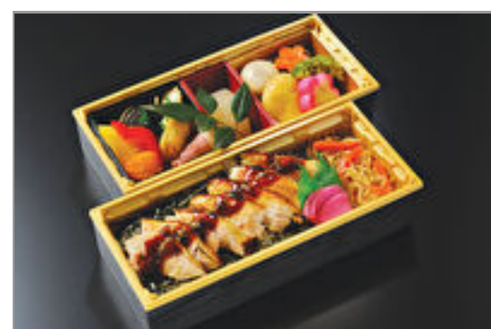
焼き鳥幕の内弁当