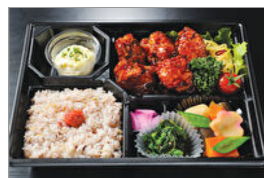
極みからあげ南蛮のお弁当