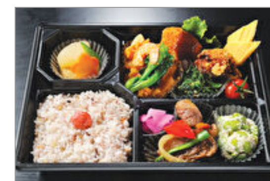
【日替り】日替わりスペシャル弁当