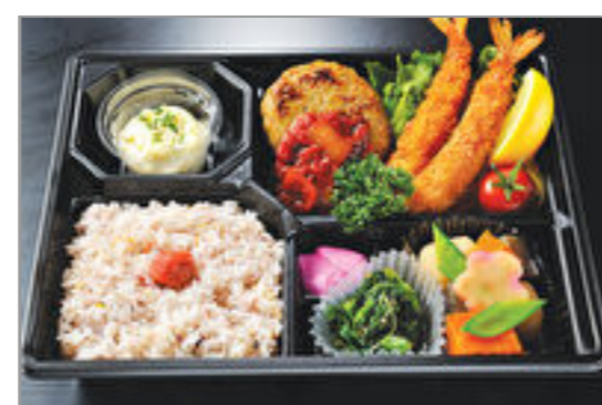
てごねハンバーグとエビフライの弁当