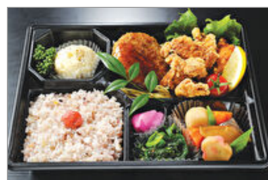
ハンバーグと極み唐揚げのお弁当

商品によっては、注文条件やオプション・サービス等がございますので、詳しくは WEB でご確認ください。