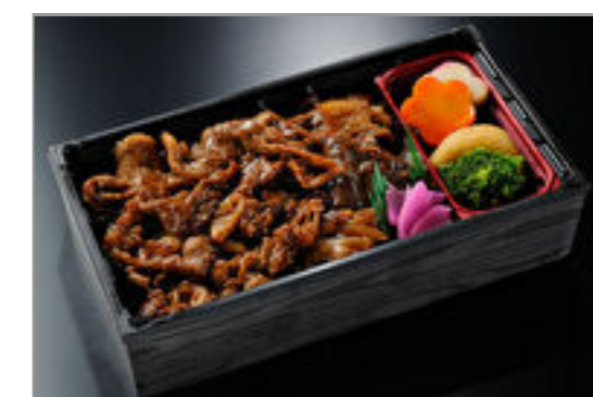
特上赤身の焼肉重