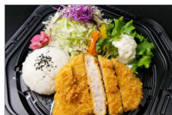
極上熟成ロースかつ

商品によっては、注文条件やオプション・サービス等がございますので、詳しくは WEB でご確認ください。