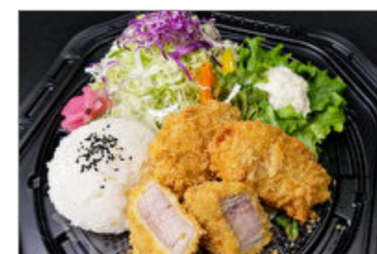
極上熟成ヒレかつ3枚