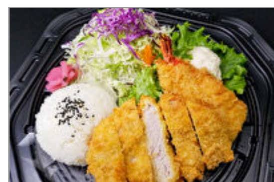
極上熟成重ねかつ&海老ふりゃあ