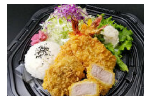
極上熟成ヒレかつ2枚&海老ふりゃあ2本