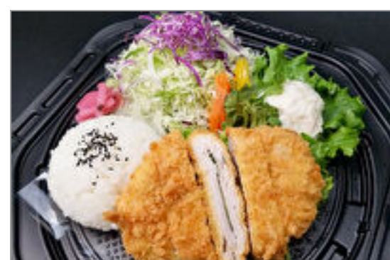
極上熟成梅しそ重ねかつ