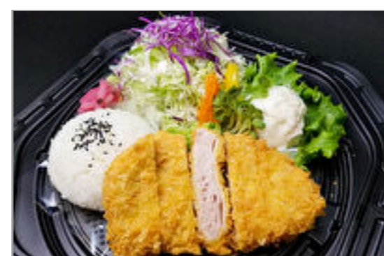
極上熟成重ねかつ