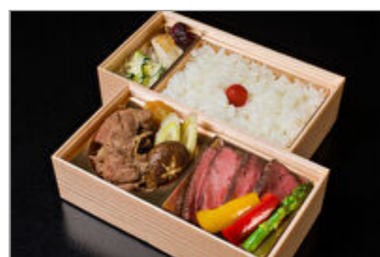
赤城牛すき焼きとローストビーフ御膳