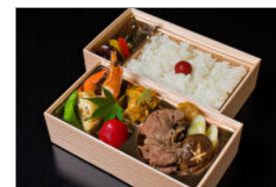
赤城牛すき焼き御膳