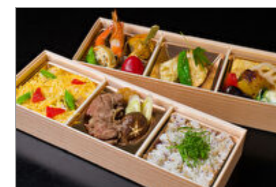
茶寮いま泉特選御膳