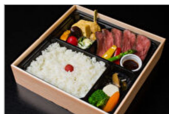
赤城牛ローストビーフ御膳