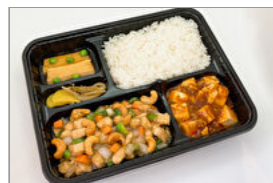
鶏肉とカシューナッツ炒め弁当