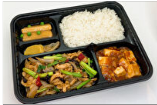
鶏肉と木耳のブラックペッパーソース弁当