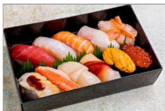
杏 特選握り11貫盛り