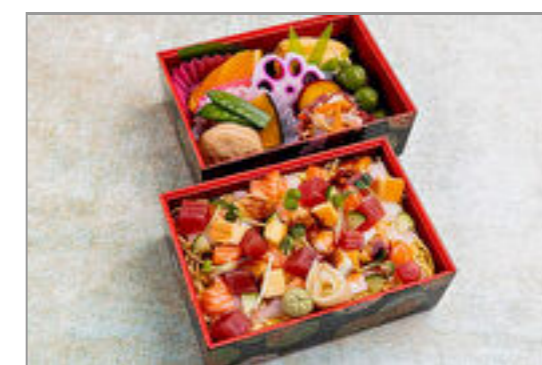
瑠璃 バラちらし二段重