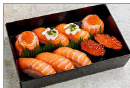
凌 サーモンづくし