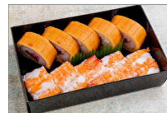
華水 伊達巻寿司 / 海老の押し寿司