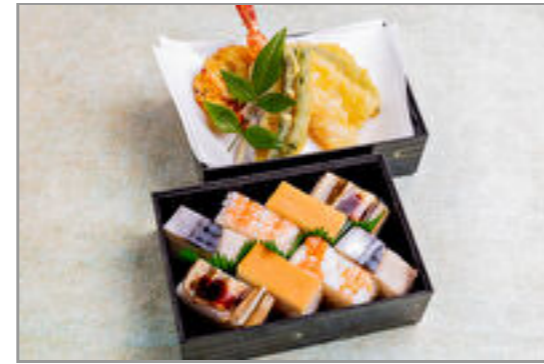
若水 押寿司と天ぷら二段重