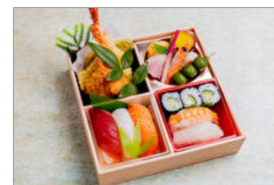
赤絵 握り松花堂弁当