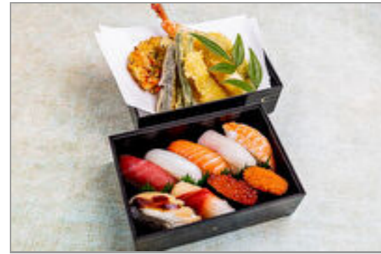
琥珀 握り9貫盛りと天ぷら二段重