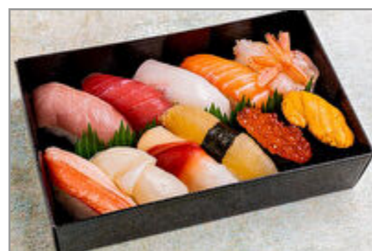
粹 極上握り11貫盛り