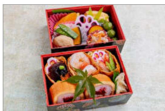
千鳥 かわり稲荷二段重

商品によっては、注文条件やオプション・サービス等がございますので、詳しくは WEB でご確認ください。