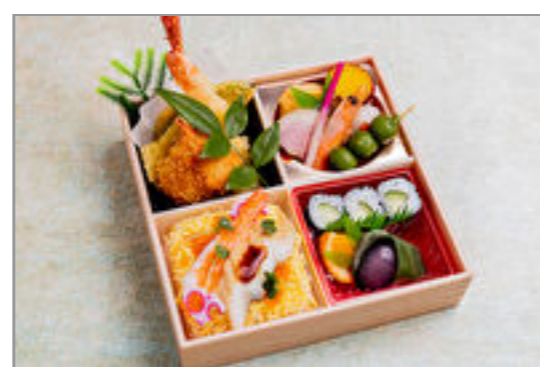
伊万里 ちらし松花堂弁当