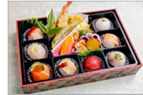
七宝 手まり寿司いろいろ