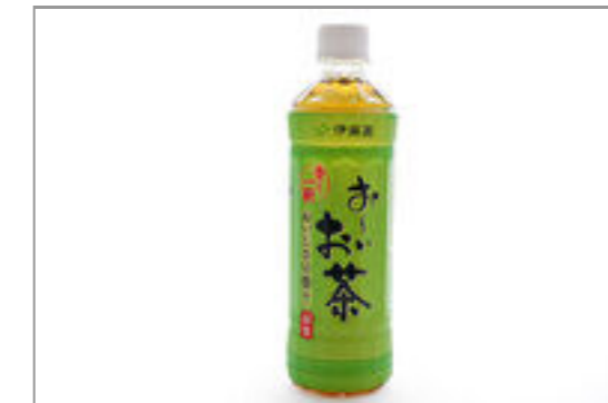
お〜いお茶(500ml ペットボトル)