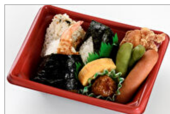
ふるさとむすび弁当