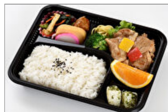
ハイパフォーマンス弁当