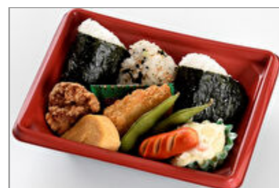
なごみむすび弁当