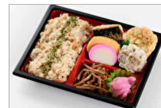
行楽たきこみ弁当