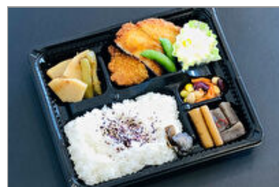
とんかつのお弁当