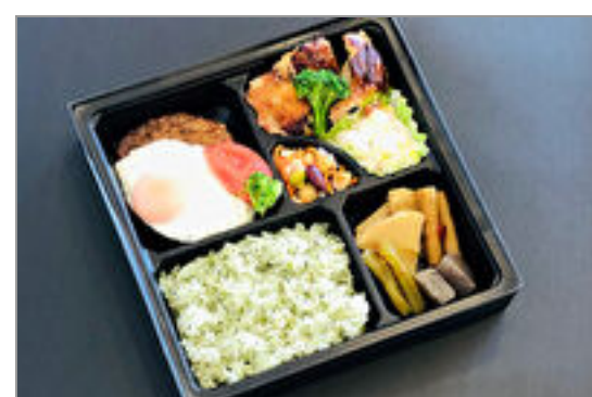
チキンソテーとエッグハンバーグのお弁当