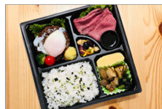
ローストビーフとエッグハンバーグのお弁当