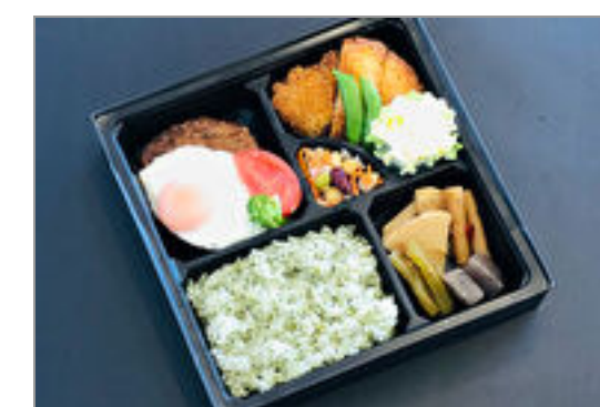
とんかつとエッグハンバーグのお弁当