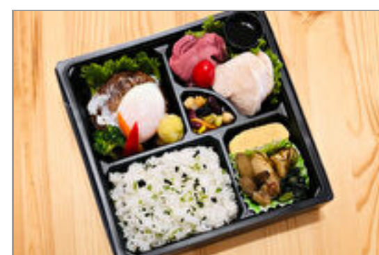
ローストビーフ&サラダチキンとエッグハンバーグのお弁当