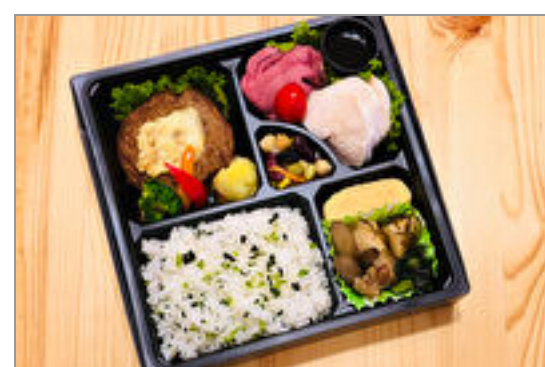
ローストビーフ&サラダチキンとチーズハンバーグのお弁当

商品によっては、注文条件やオプション・サービス等がございますので、詳しくはWEBでご確認ください。