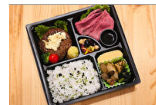
ローストビーフとチーズハンバーグのお弁当