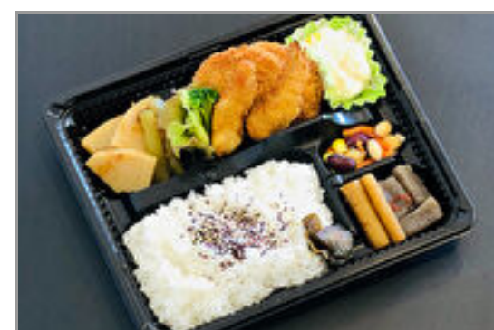
フライ盛り合わせのお弁当