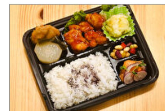
ヤンニョムチキンのお弁当