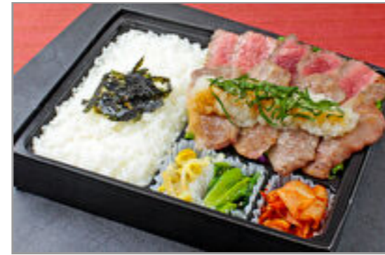
近江牛カルビとシタマステーキおろしポン酢弁当