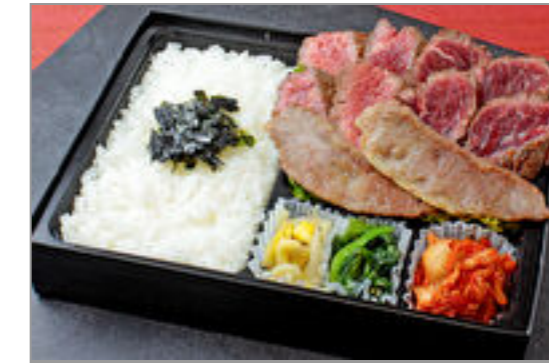
焼肉すだくの3種盛り(近江牛カルビ、牛ハラミ、シタマステーキ)