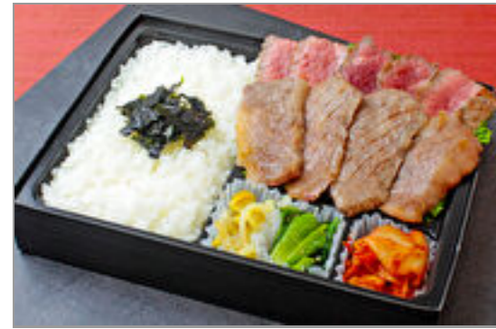
近江牛カルビとシタマステーキ弁当