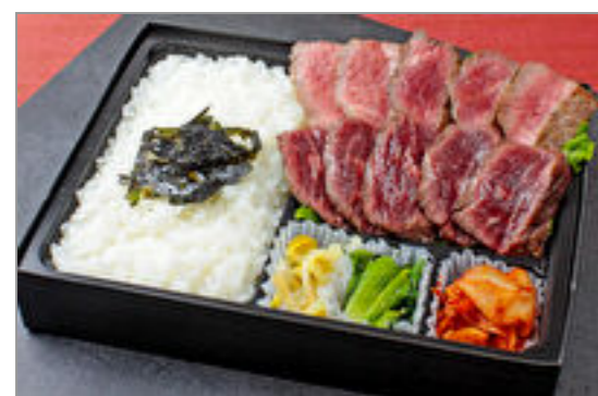
牛ハラミとやわらかシタマステーキ2種盛り弁当