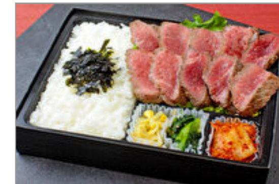
やわらかシタマステーキ弁当