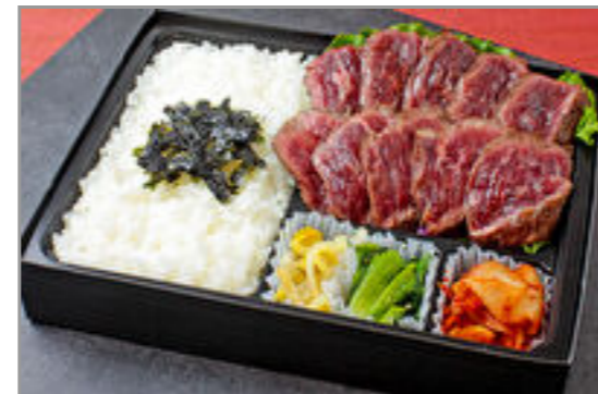
牛ハラミステーキ弁当