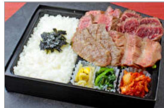
焼肉すだくの4種盛り(近江牛カルビ、牛たん、牛ハラミ、シタマステーキ)