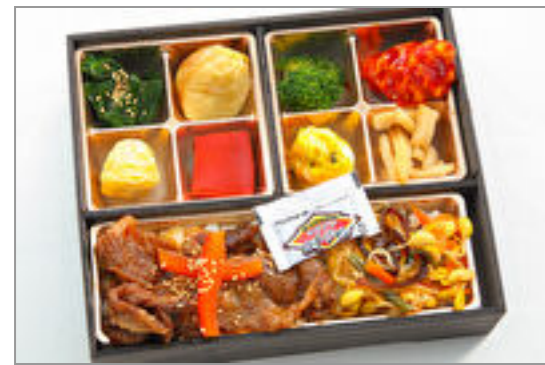
神戸牛切り落とし焼肉重小膳～花Hana～

商品によっては、注文条件やオプション・サービス等がございますので、詳しくはWEBでご確認ください。