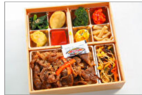
神戸牛焼肉弁当～開Kai～