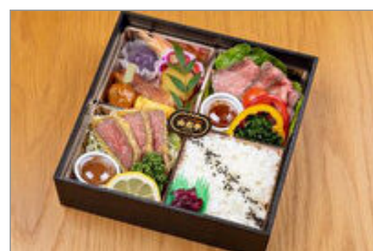
山形牛幕の内御膳

商品によっては、注文条件やオプション・サービス等がございますので、詳しくは WEB でご確認ください。