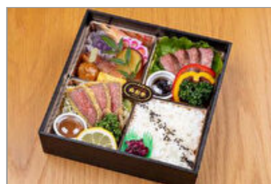
山形牛特上幕の内御膳