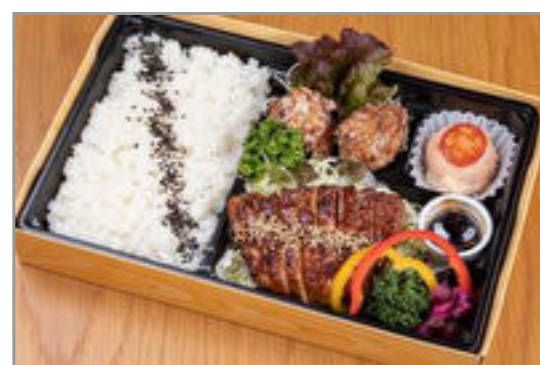
極厚切り豚の生姜焼き御膳