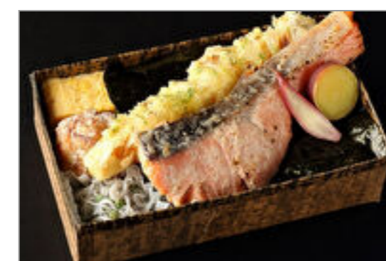
天華ノ高級海苔弁