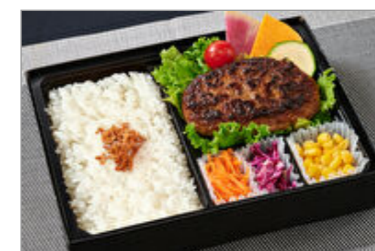
ふっくらジューシーハンバーグ弁当