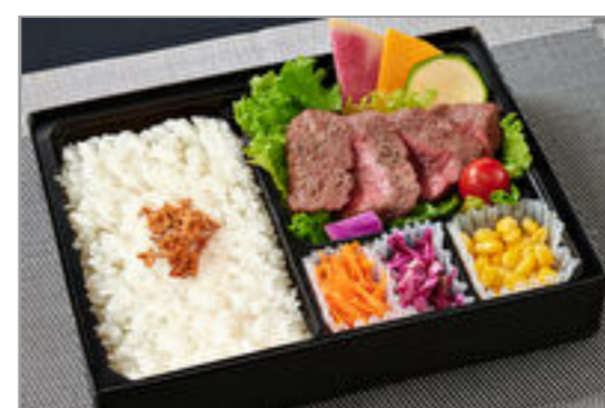
旨み深い赤身肉 シンタマステーキ弁当