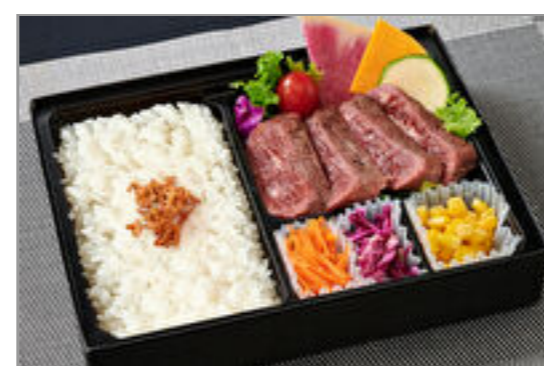
熟成やわらか牛ハラミステーキ弁当