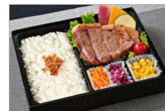
サーロインステーキ弁当