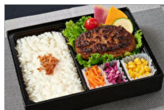
ふっくらジューシーハンバーグ弁当

商品によっては、注文条件やオプション・サービス等がございますので、詳しくは WEB でご確認ください。