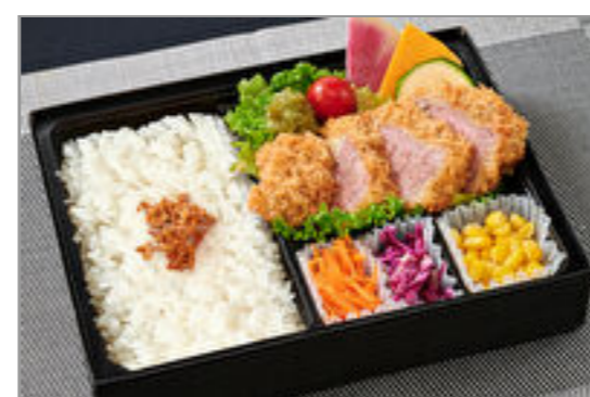
塊肉をじっくり揚げた赤身肉の牛カツ弁当