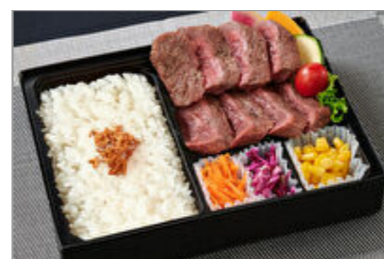
熟成牛ハラミ&シンタマステーキ2種盛り弁当