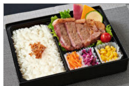
サーロインステーキ弁当