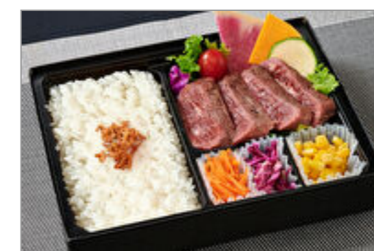
熟成やわらか牛ハラミステーキ弁当