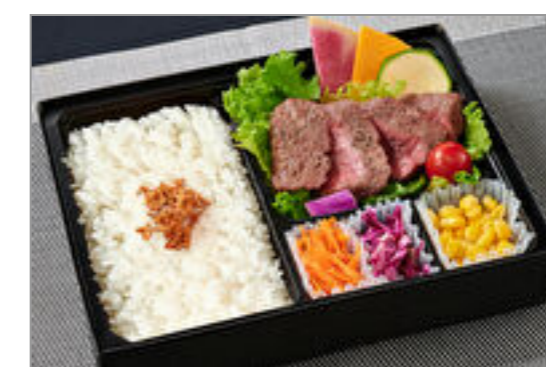
旨み深い赤身肉 シンタマステーキ弁当