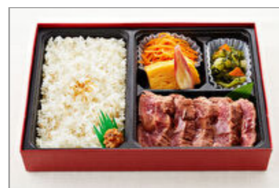
せんりのおいしいハラミ御膳(90g)