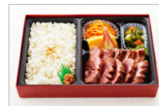
厚切り牛たん御膳(120g)