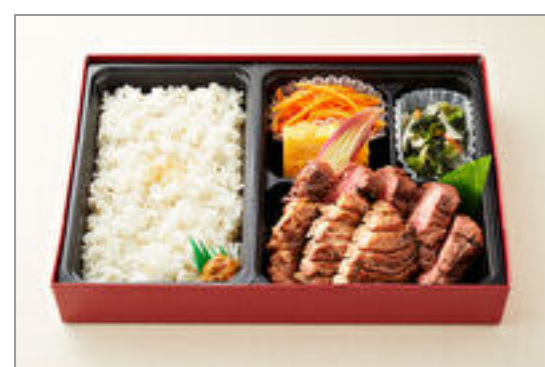
厚切り牛たん&ハラミ2種の食べ比べ御膳

商品によっては、注文条件やオプション・サービス等がございますので、詳しくは WEB でご確認ください。