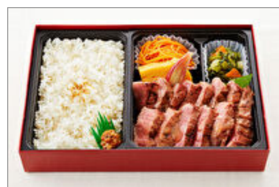
厚切り牛たん御膳(150g)