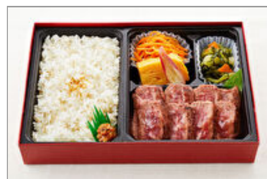
せんりのおいしいハラミ御膳(150g)