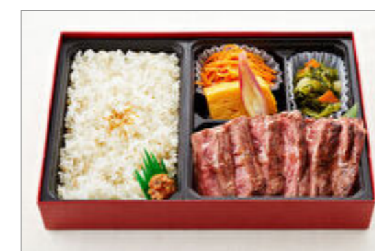
せんりのおいしいハラミ御膳(120g)