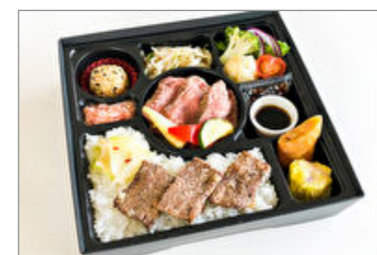
厳選牛ヒレステーキ&牛カルビ飯御膳