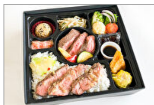
厳選牛サーロインステーキ&牛ロース飯御膳