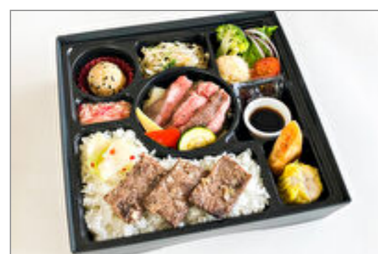
厳選牛サーロインステーキ&牛カルビ飯御膳