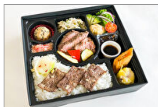
厳選牛ロースステーキ&牛カルビ飯御膳