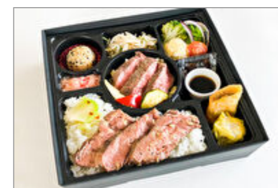
厳選牛サーロインステーキ&牛ヒレ飯御膳