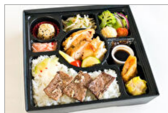
厳選鶏ステーキ&牛カルビ飯御膳

商品によっては、注文条件やオプション・サービス等がございますので、詳しくは WEB でご確認ください。