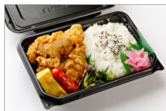
昭和の唐揚げ弁当