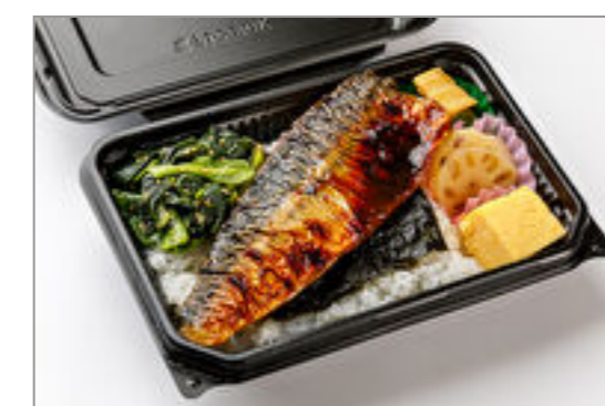
さばみそ焼き弁当