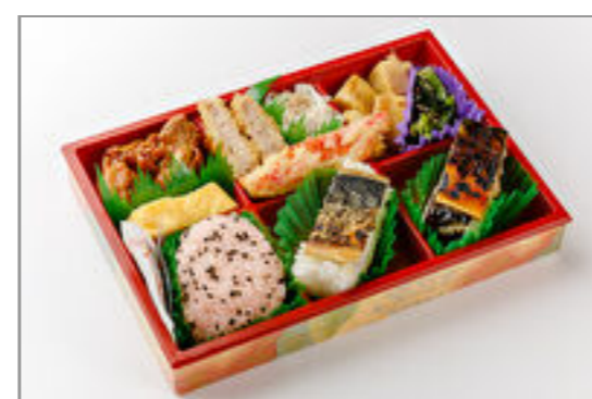
2種の焼鯖寿司御膳