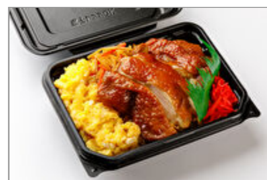
鶏チャーシューの親子丼