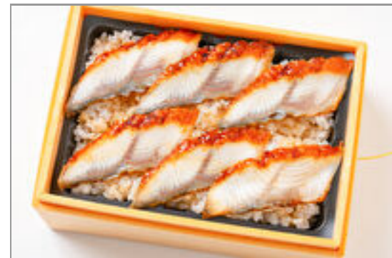
【温まる】Hot!うな重(寿) 2,000円(税込2,160円) / 品番:TKJO012