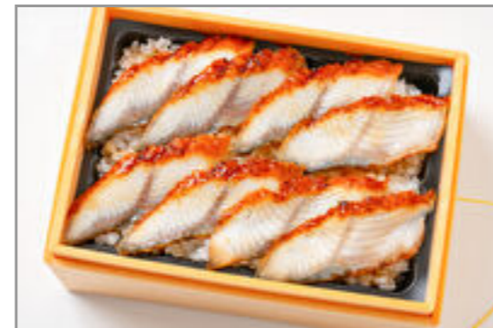
【温まる】Hot!うな重(禄) 2,300円(税込2,484円) / 品番:TKJO013