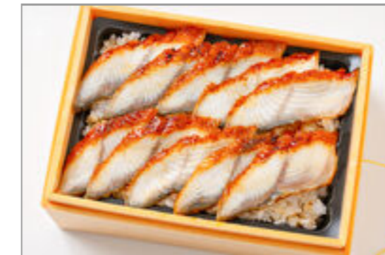
【温まる】Hot!うな重(福) 2,500円(税込2,700円) / 品番:TKJO014