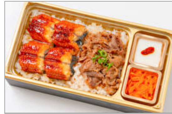
うな牛すき重(寿) 2,000円(税込2,160円) / 品番:TKJO009