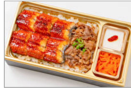
うな牛すき重(禄) 2,300円(税込2,484円) / 品番:TKJO010