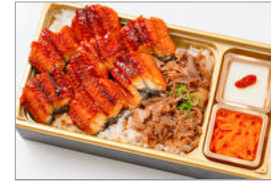
うな牛すき重(福) 2,500円(税込2,700円) / 品番:TKJO011