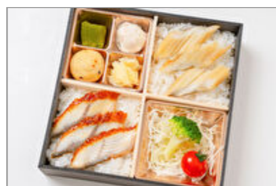
【夏季限定】鰻と穴子のスタミナ満点コンビ弁当