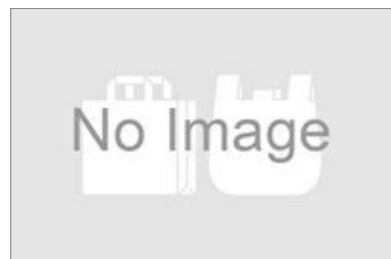
小分け用ビニール袋 3円(税込3円) / 品番:TKJO1001