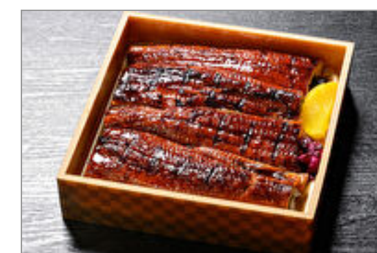
月島特製うなぎ弁当(極)