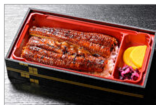
月島特製うなぎ弁当(上)

商品によっては、注文条件やオプション・サービス等がございますので、詳しくは WEB でご確認ください。