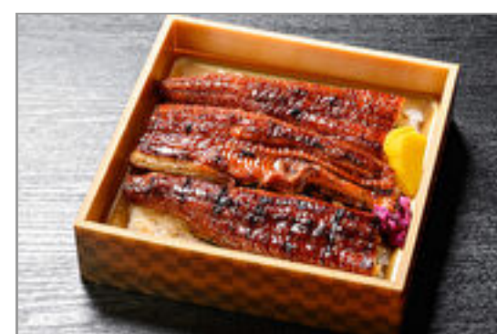
月島特製うなぎ弁当(特上)