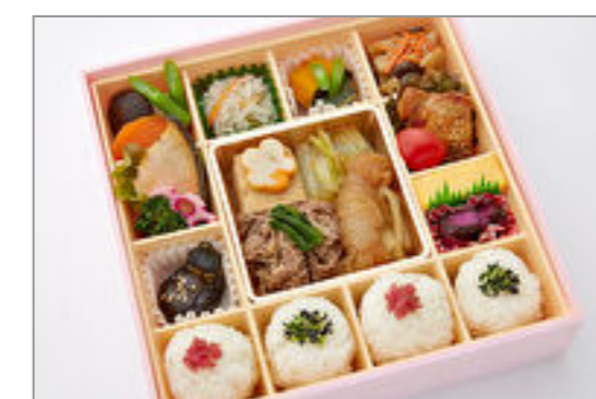
彩り菜膳～牛すきやき～