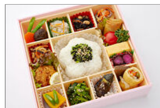
彩り菜膳～若菜ご飯～