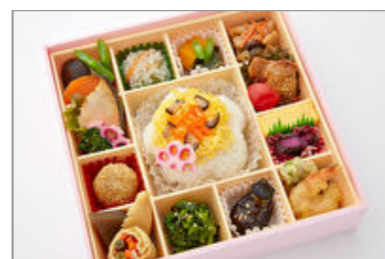
彩り菜膳～華ちらし～