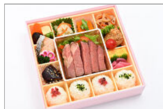
彩り菜膳～牛ローストビーフ～