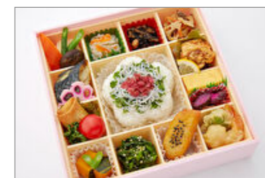
彩り菜膳～しらすご飯～