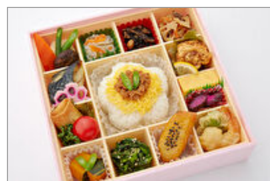
彩り菜膳～肉そぼろ～