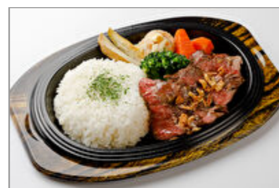
ビーフステーキ100g弁当