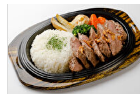
ビーフステーキ200g弁当