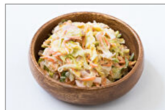
ミニコールスロー