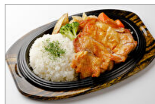
国産チキンステーキ弁当