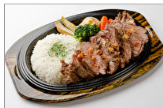
ビーフステーキ300g弁当