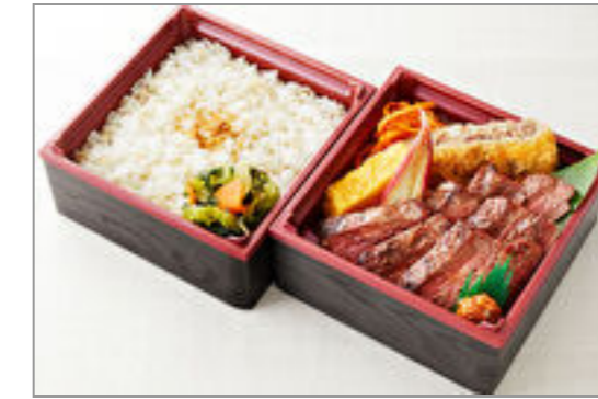
せんりのおいしいハラミ二段御膳(120g) 2,500円(税込2,700円) / 品番:KCAN014 お茶付き