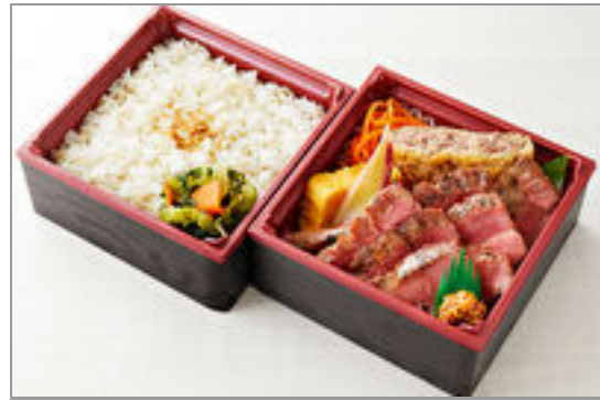
厚切り牛たん二段御膳(120g) 3,200円(税込3,456円) / 品番:KCAN011 お茶付き