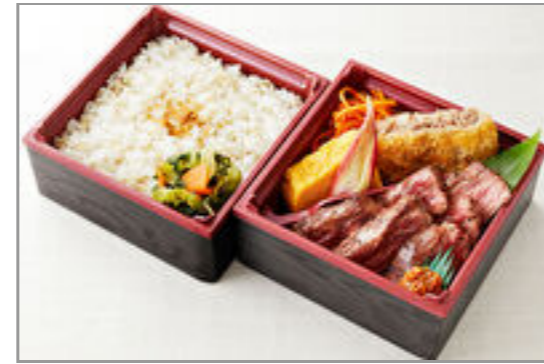
せんりのおいしいハラミ二段御膳(90g) 2,300円(税込2,484円) / 品番:KCAN013 お茶付き