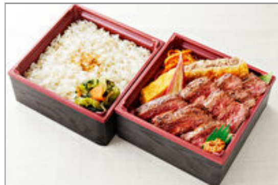
せんりのおいしいハラミ二段御膳(150g) 2,700円(税込2,916円) / 品番:KCAN015 お茶付き