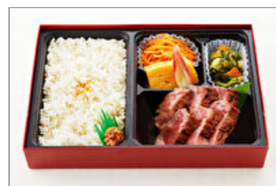
厚切り牛たん御膳(90g)