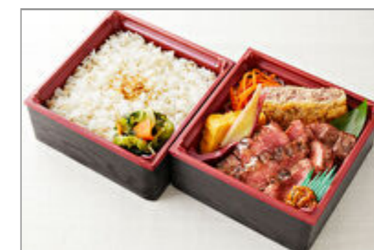
厚切り牛たん二段御膳(90g)