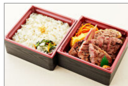
厚切り牛たん&ハラミ2種の食べ比べ二段御膳