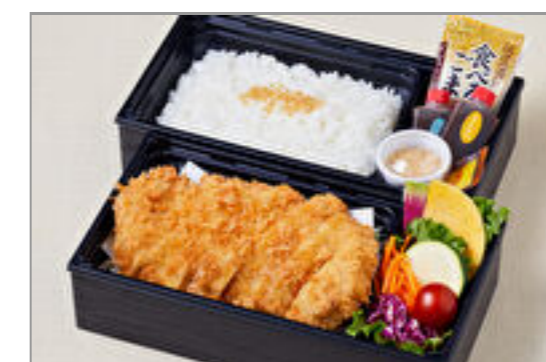
神楽の厚切りロースカツ御膳