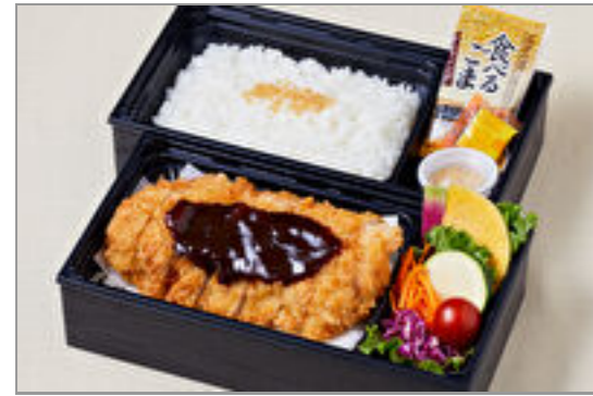
こっくり味噌だれロースカツ御膳