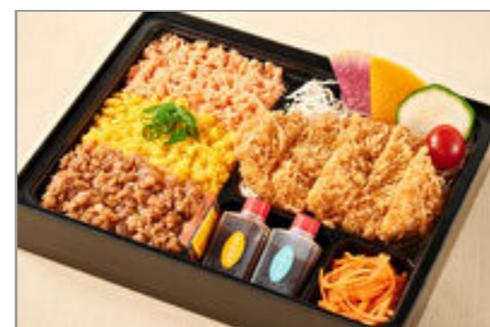
神楽のお得な三色そばろとロースカツ弁当