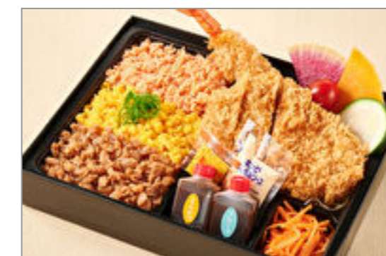
神楽のお得な三色そばろとロースカツとエビフライ弁当