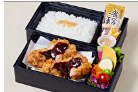
こっくり味噌だれフィレブリアン御膳