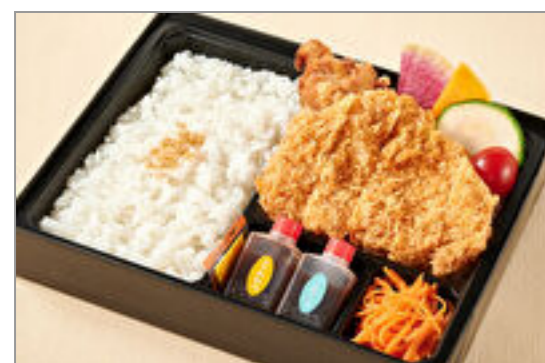
神楽のお得なロースカツと鶏の唐揚げ弁当