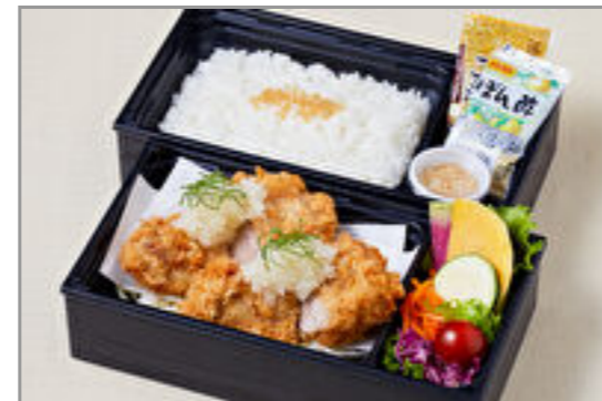
おろしたっぷりフィレブリアン御膳