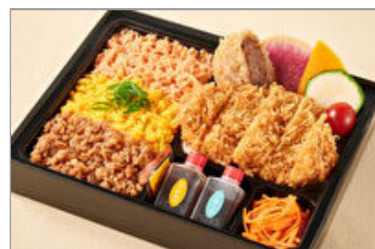
神楽のお得な三色そばろとロースカツと牛たんメンチカツ弁当