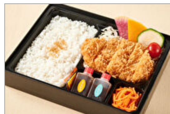
神楽のお得なロースカツ弁当

商品によっては、注文条件やオプション・サービス等がございますので、詳しくは WEB でご確認ください。