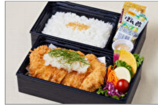
おろしたっぷりロースカツ御膳