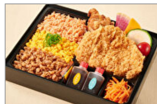
神楽のお得な三色そばろとロースカツと鶏の唐揚げ弁当