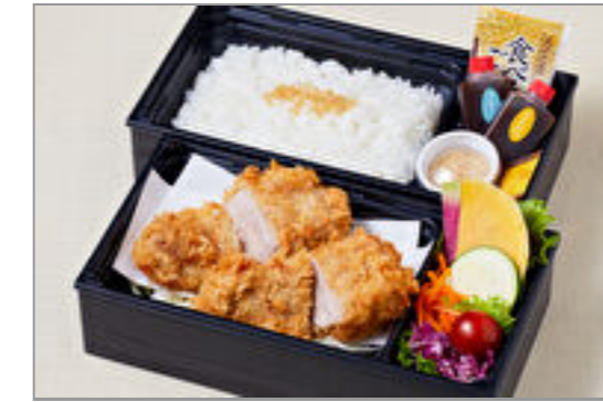
やわらか厚切りフィレブリアン御膳