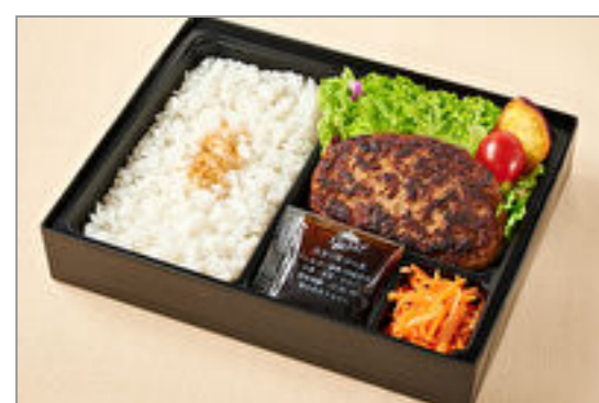
福よしのはんばーぐ弁当

商品によっては、注文条件やオプション・サービス等がございますので、詳しくは WEB でご確認ください。