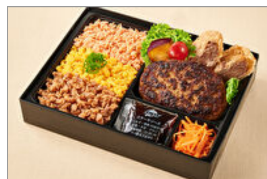
福よしの三色そばろはんばーぐ&牛たんメンチカツ弁当