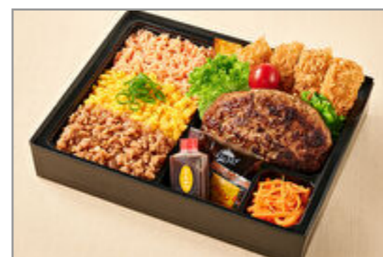
福よしの三色そばろはんばーぐ&ロースカツ弁当