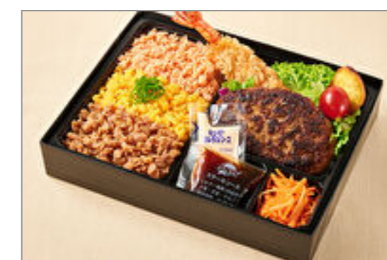
福よしの三色そばろはんばーぐ&エビフライ弁当