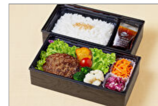
とろけるはんばーぐ御膳