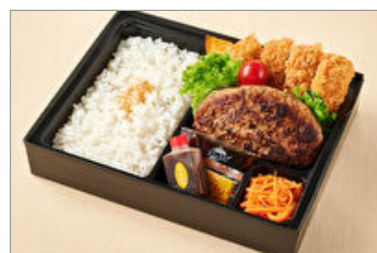
福よしのはんばーぐ&ロースカツ弁当