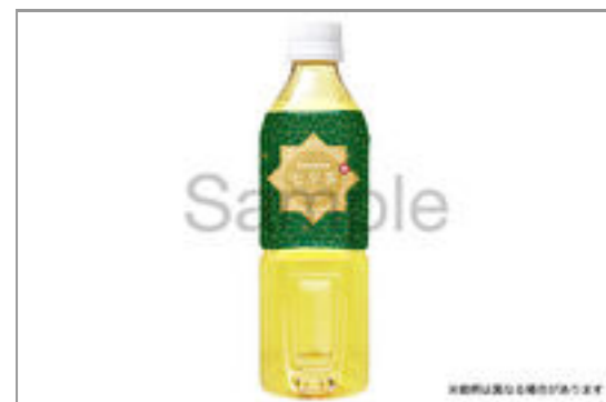
緑茶(500ml ペット ボトル)