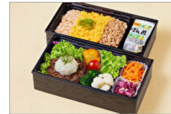
とろけるおろしはんばーぐ &三色そばろ御膳