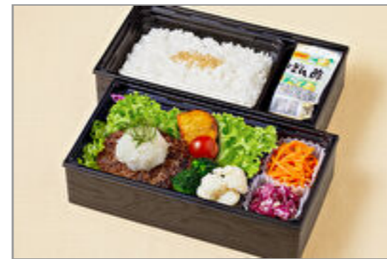
とろけるおろしはんばーぐ 御膳