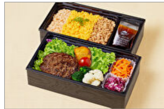
とろけるはんばーぐ&三色 そばろ御膳