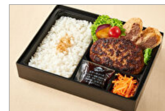
福よしのはんばーぐ&牛たんメンチカツ弁当