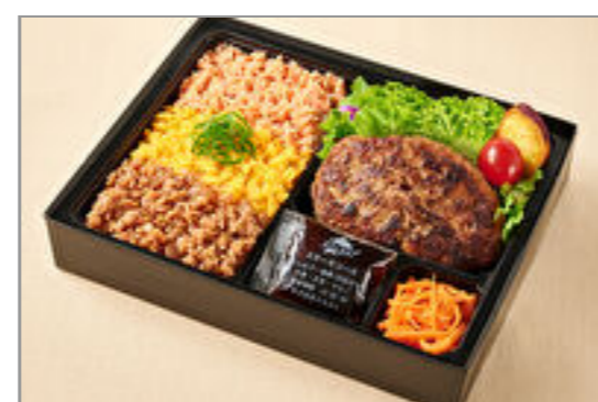
福よしの三色そばろはんばーぐ弁当