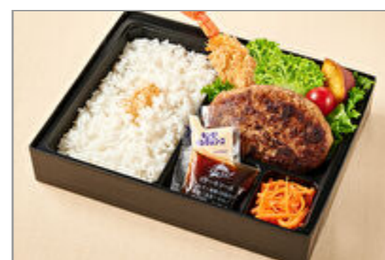
福よしのはんばーぐ&エビフライ弁当