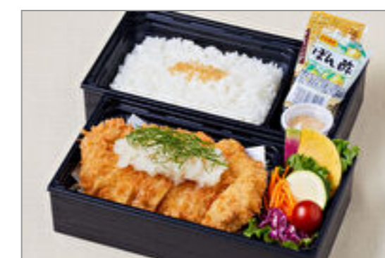
おろしたっぷりロースカツ御膳