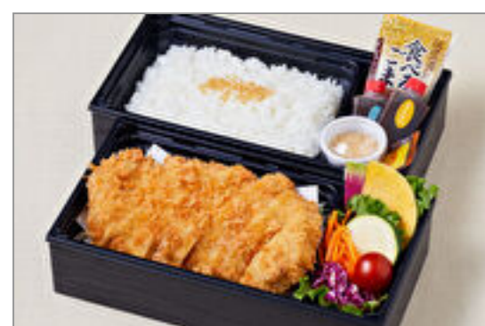
神楽の厚切りロースカツ御膳

商品によっては、注文条件やオプション・サービス等がございますので、詳しくは WEB でご確認ください。