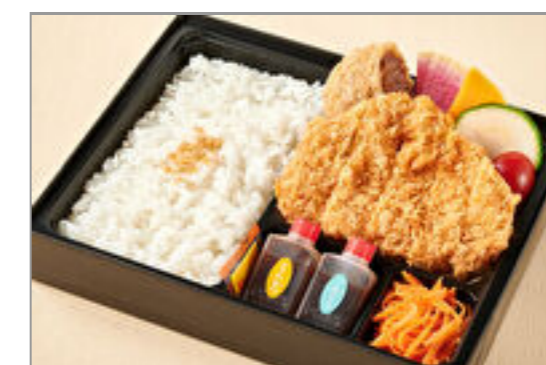
神楽のお得なロースカツと牛たんメンチカツ弁当