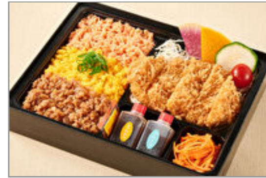
神楽のお得な三色そぼろと ロースカツ弁当 1,300円(税込1,404円) / 品番:KTCT011