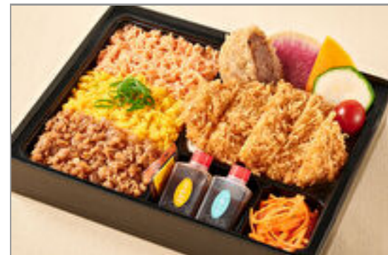
神楽のお得な三色そぼろと ロースカツと牛たんメンチ カツ弁当 1,500円(税込1,620円) / 品番:KTCT013