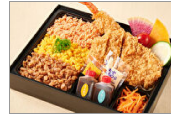
神楽のお得な三色そぼろと ロースカツとエビフライ弁 当 1,500円(税込1,620円) / 品番:KTCT012