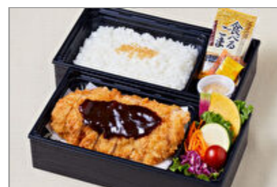
こっくり味噌だれロースカツ御膳