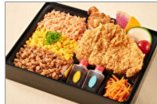
神楽のお得な三色そぼろと ロースカツと鶏の唐揚げ弁 当 1,300円(税込1,404円) / 品番:KTCT014