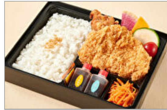
神楽のお得なロースカツと 鶏の唐揚げ弁当 1,000円(税込1,080円) / 品番:KTCT010