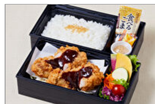
こっくり味噌だれフィレブリアン御膳