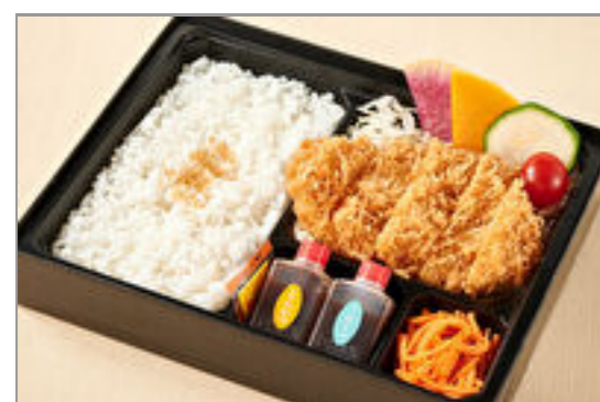
神楽のお得なロースカツ弁当