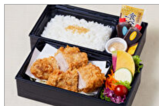
やわらか厚切りフィレブリアン御膳