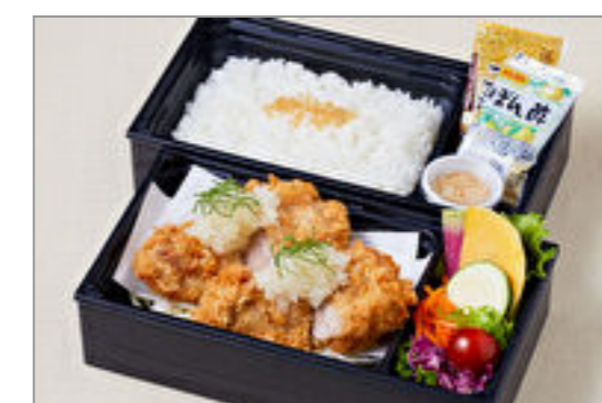
おろしたっぷりフィレブリアン御膳