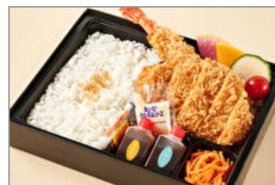
神楽のお得なロースカツとエビフライ弁当