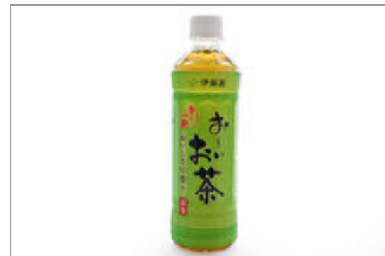
お〜いお茶(500ml ペットボトル)