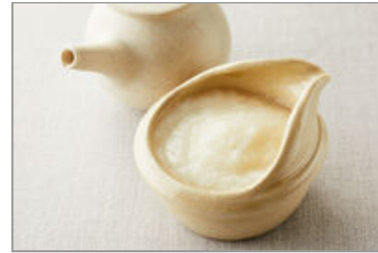
とろろ(特製出汁しょうゆ付き)