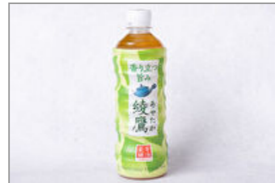
綾鷹(500ml ペットボトル)