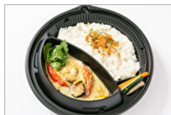
シーフードグリーンカレー

商品によっては、注文条件やオプション・サービス等がございますので、詳しくは WEB でご確認ください。