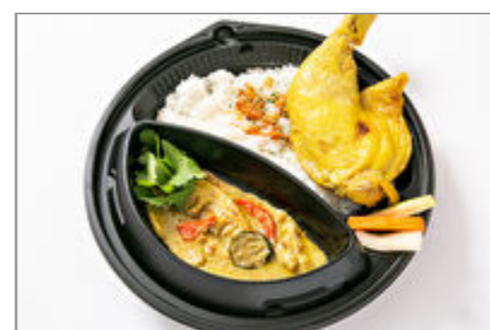
チキングリーンカレー