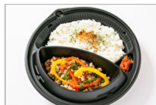
コクうまガパオライス