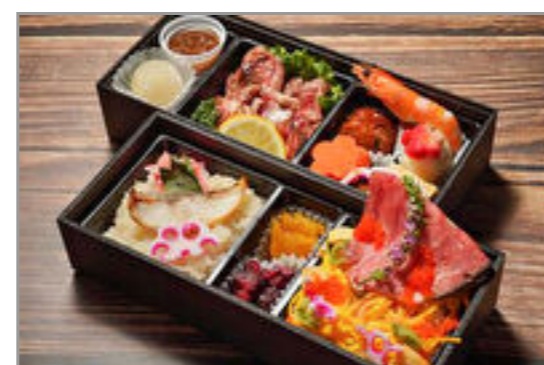
肉ちらしと鯛おこわとステーキの二段重