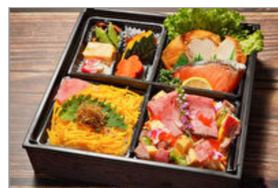
【牛肉ちらし・ちりめん山椒ご飯】鶏の照り焼きと焼き鮭御膳