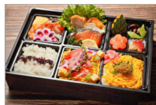
【厳選牛肉ちらし・ちりめん山椒ご飯】鶏の照り焼きと焼き鮭御膳