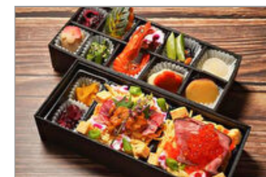
【豪華】ウニとステーキちらし・いくらとローストビーフちらしの彩り野菜の二段重