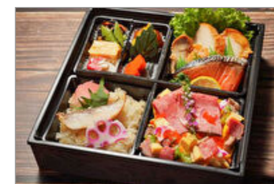
【牛肉ちらし・鯛おこわ】鶏の照り焼きと焼き鮭御膳