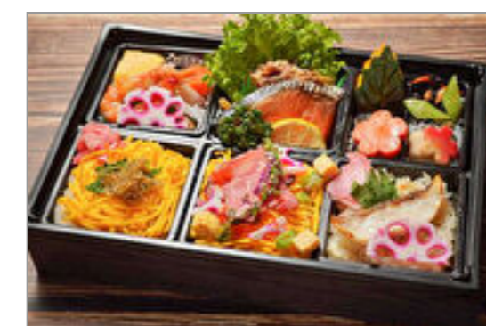
【牛肉ちらし・鯛おこわ・ちりめん山椒ご飯】牛しぐれと焼き鮭御膳