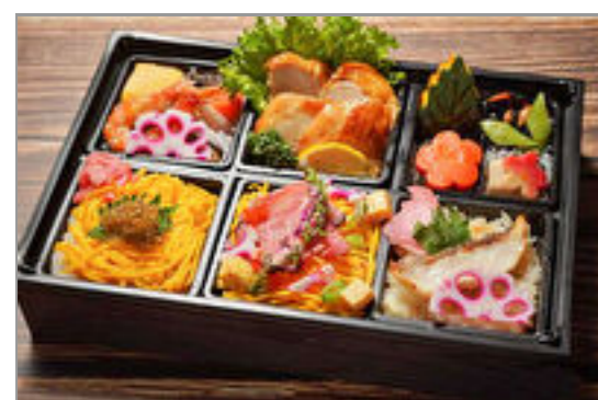
【牛肉ちらし・鯛おこわ・ちりめん山椒ご飯】鶏の西京焼き御膳