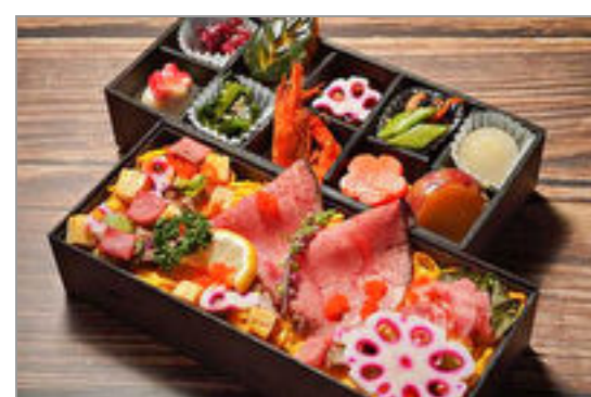
豪華肉ちらしと彩り野菜の二段重