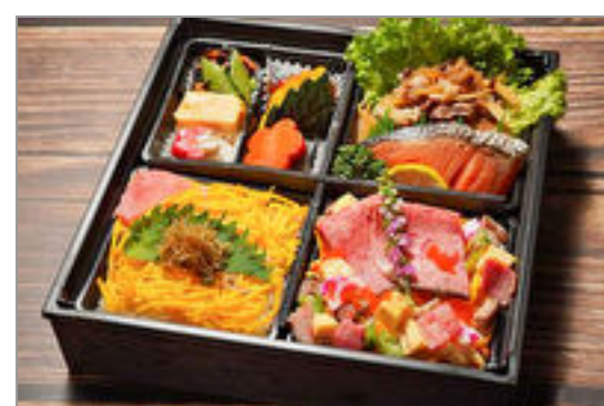
【牛肉ちらし・ちりめん山椒ご飯】牛しぐれと焼き鮭御膳

商品によっては、注文条件やオプション・サービス等がございますので、詳しくはWEBでご確認ください。