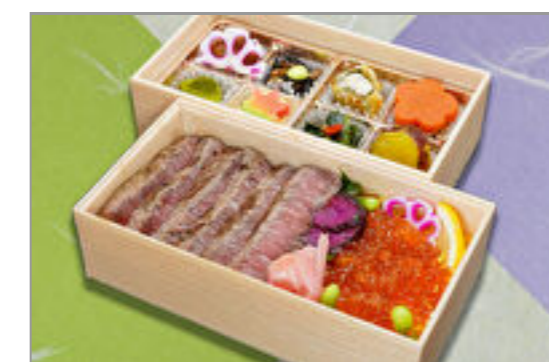
豪華絢爛サーロインステー キといくら二段重 4,630円(税込5,000円) / 品番:SFHF024 お茶付き