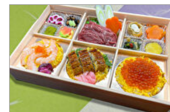
豪華牛すき焼きと寿司三種 盛り 3,241円(税込3,500円) / 品番:SFHF021 お茶付き