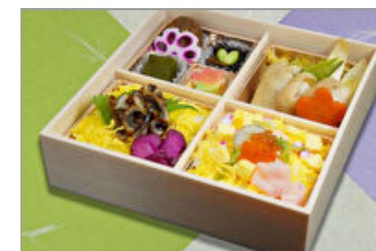
海鮮チラシと鶏すき焼きひつまぶし御膳