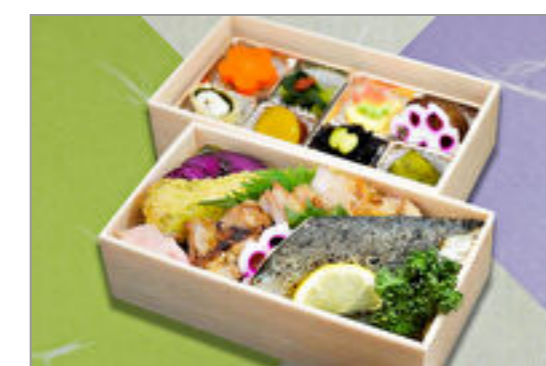
鶏照焼と焼魚海苔二段重