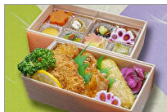
鶏照焼ヒレカツ海苔二段重