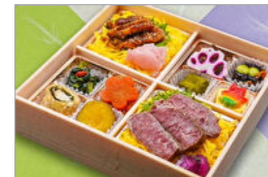
牛ステーキとひつまぶし御膳 1,593円(税込1,720円) / 品番:SFHF012 お茶付き