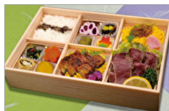
牛ステーキと鰻ちりめん山 椒御膳 2,093円(税込2,260円) / 品番:SFHF019 お茶付き