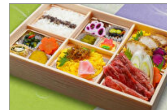
牛すき焼きちりめん山椒と 鶏照焼御膳 1,945円(税込2,100円) / 品番:SFHF015 お茶付き