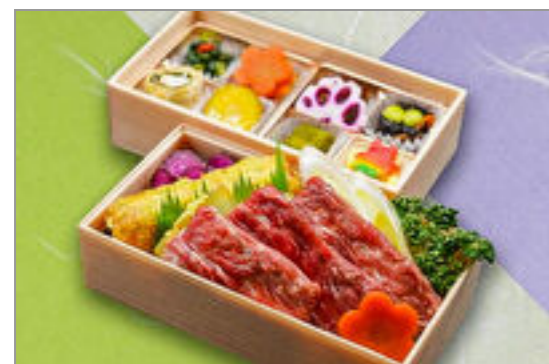
牛すき焼き高級海苔二段重 1,593円(税込1,720円) / 品番:SFHF010 お茶付き