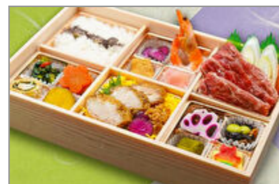
牛すき焼きと鶏照焼御膳 1,945円(税込2,100円) / 品番:SFHF014 お茶付き