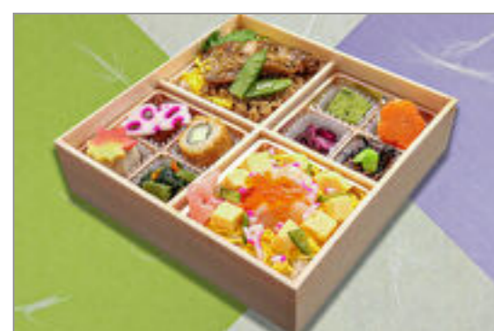
海鮮チラシと鶏照焼丼御膳