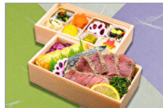
牛ステーキ焼魚海苔二段重 1,593円(税込1,720円) / 品番:SFHF011 お茶付き