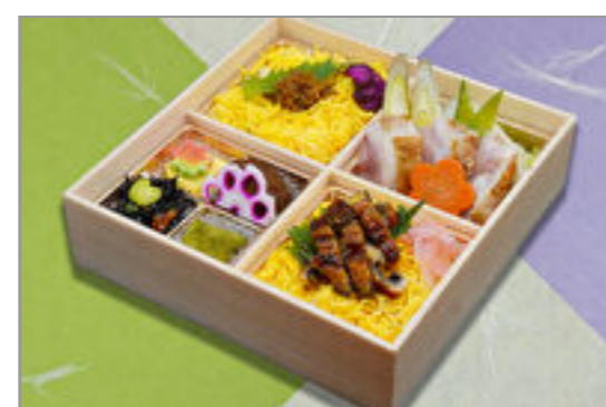
鶏すき焼きちりめん山椒とひつまぶし御膳