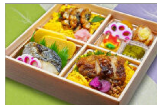
鶏照焼ひつまぶしと焼魚御膳