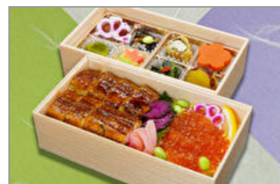
豪華鰻といくら二段重 3,704円(税込4,000円) / 品番:SFHF023 お茶付き