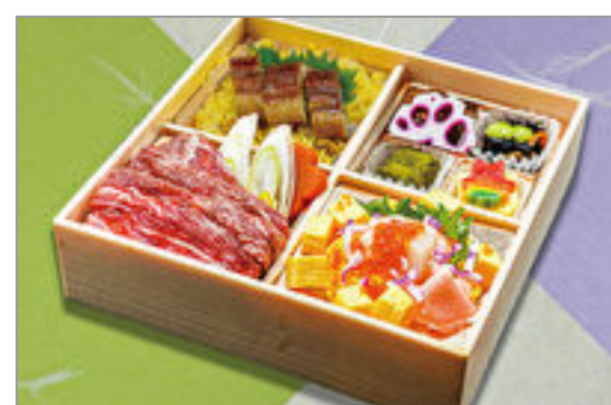
海鮮チラシと牛すき焼き鰻 御膳 1,945円(税込2,100円) / 品番:SFHF016 お茶付き