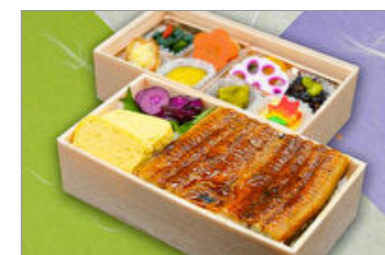
鰻二段重 2,093円(税込2,260円) / 品番:SFHF018 お茶付き