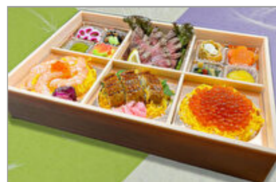
豪華牛ステーキと寿司三種 盛り 3,241円(税込3,500円) / 品番:SFHF022 お茶付き