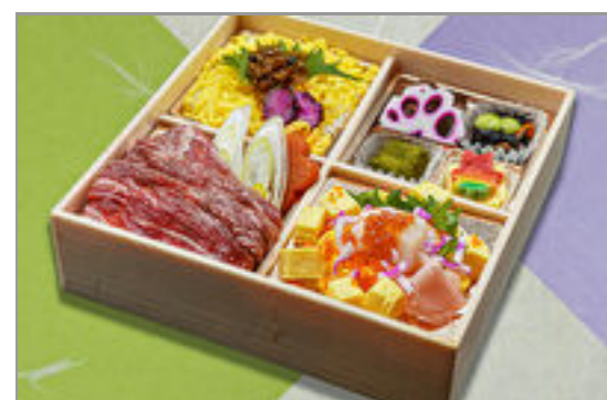
海鮮チラシとちりめん山椒 牛すき焼き御膳 1,593円(税込1,720円) / 品番:SFHF013 お茶付き