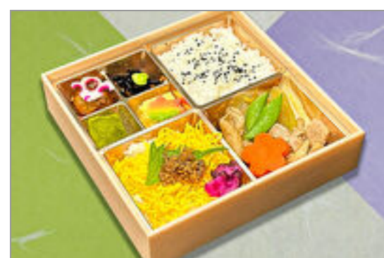
ちりめん山椒ご飯と鶏すき焼き御膳

商品によっては、注文条件やオプション・サービス等がございますので、詳しくは WEB でご確認ください。