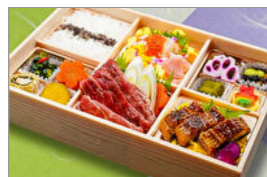
牛すき焼きと鰻海鮮ちらし 御膳 2,093円(税込2,260円) / 品番:SFHF020 お茶付き