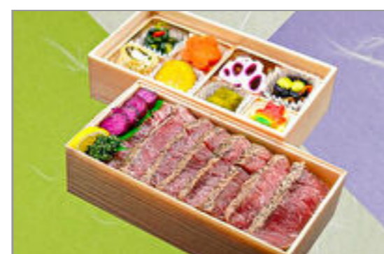
国産牛ステーキ二段重 2,945円(税込3,180円) / 品番:SFHF017 お茶付き