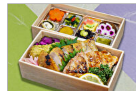
鶏照焼海苔二段重