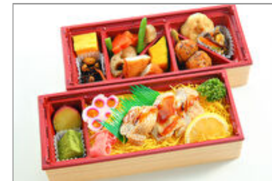
宮崎・鶏の幽庵焼き錦糸ごはん