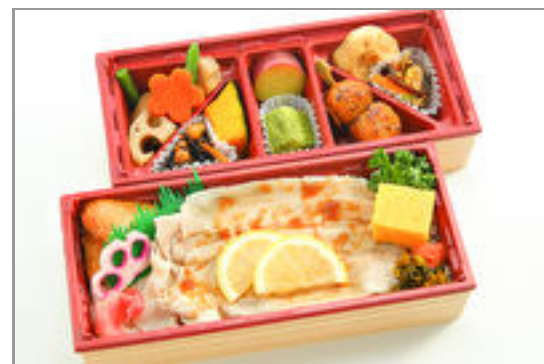
九州づくしと牛ステーキ重