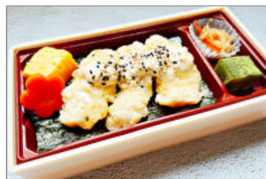
大分名物とり天南蛮弁当