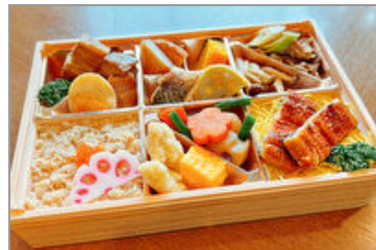
蟹めしとうな重・牛すき焼きの贅沢弁当