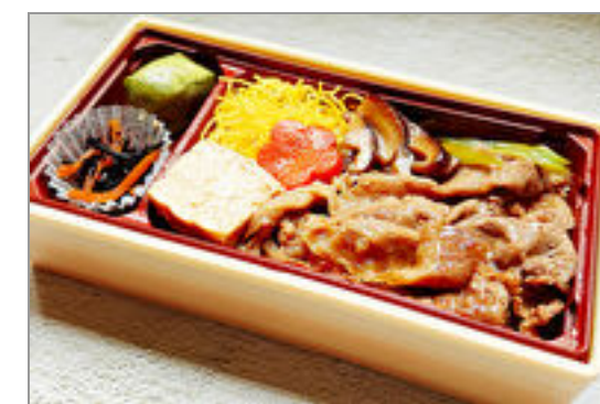
博多牛すき焼き弁当