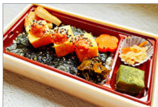
博多明太だし巻き弁当

商品によっては、注文条件やオプション・サービス等がございますので、詳しくは WEB でご確認ください。