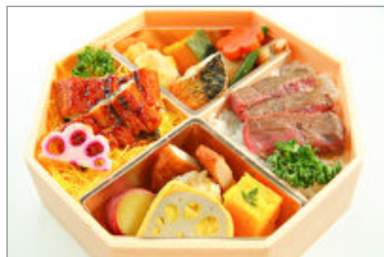
九州づくしと牛ステーキ な重の贅沢盛り