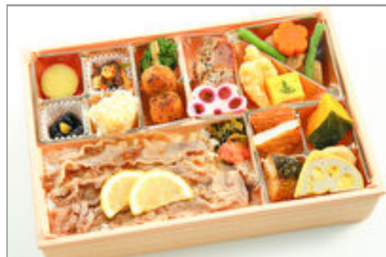
九州づくしと牛レモンステーキ