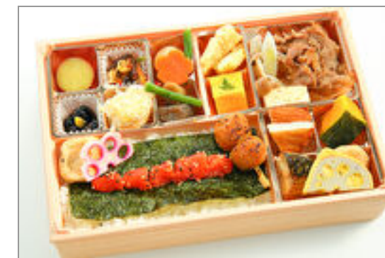
九州づくしの明太子ドーン と1本と牛すき焼き