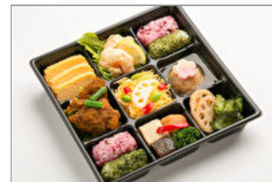
彩り9升弁当(海老マヨ・タンドリーチキン)