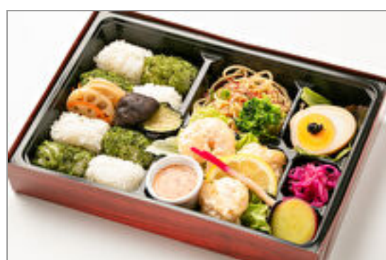
ひろひろやの箱弁 海老マヨとスイートチリソース

商品によっては、注文条件やオプション・サービス等がございますので、詳しくは WEB でご確認ください。