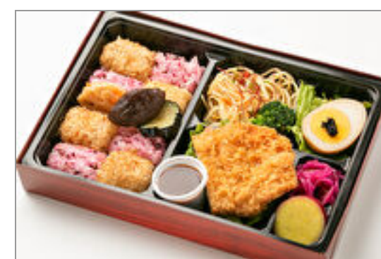
ひろひろやの箱弁 熟成豚とんかつと鰹ソース