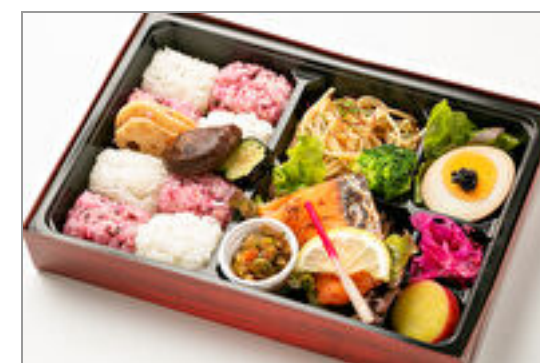
ひろひろやの箱弁 炙り焼鮭とやみつき野菜ダレ