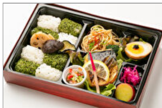
ひろひろやの箱弁 炙り焼鮭とラビゴットソース