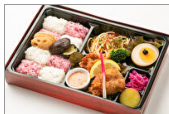
ひろひろやの箱弁 若鶏のから揚げとスイートチリソース