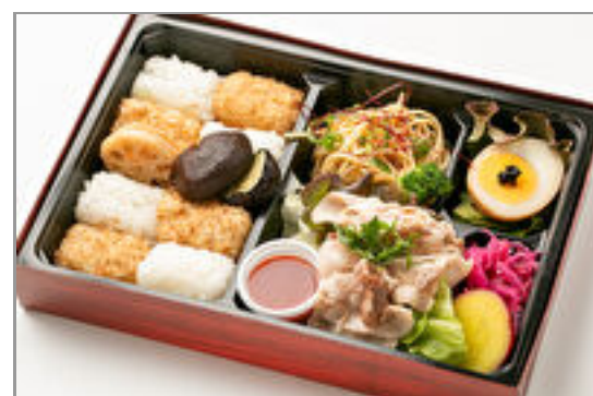
ひろひろやの箱弁 出汁豚しゃぶと梅肉ダレ