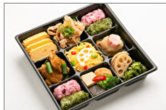
彩り9升弁当(豚の生姜焼き・タンドリーチキン)