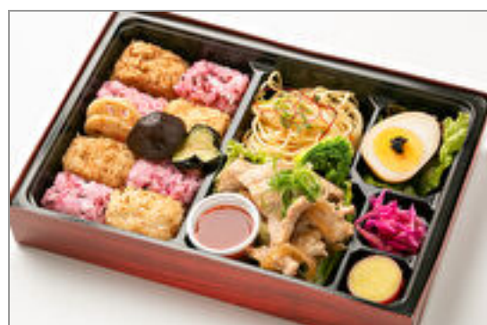
ひろひろやの箱弁 豚の生姜焼きと梅肉ダレ