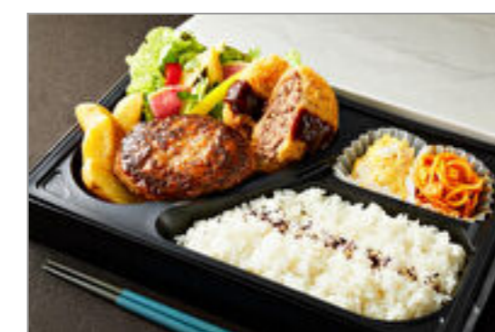
とろけるハンバーグ&牛タンメンチカツ弁当