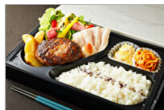
とろけるハンバーグ&蒸し鶏弁当