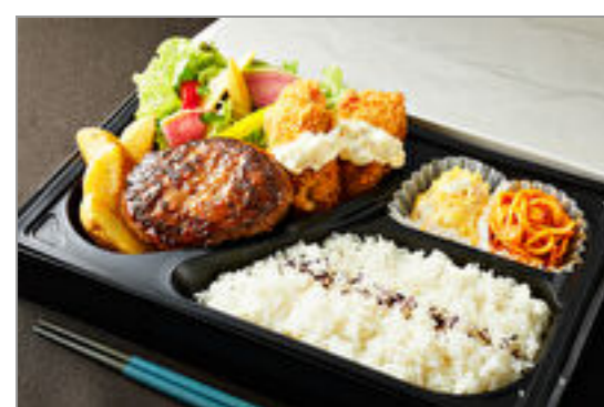
とろけるハンバーグ&カキフライ弁当

商品によっては、注文条件やオプション・サービス等がございますので、詳しくは WEB でご確認ください。