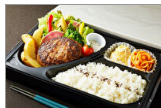
とろけるハンバーグ弁当(トリュフ塩)