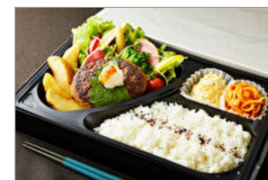
とろけるおろしハンバーグ弁当