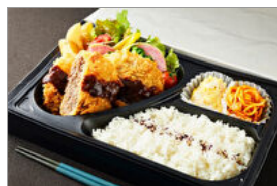
デミメンチカツ弁当