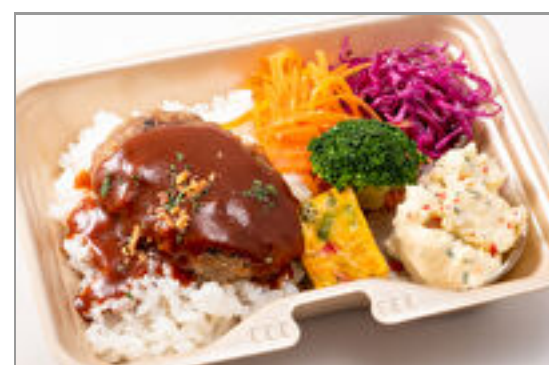
ハンバーグ～デミグラスソース～の彩り弁当