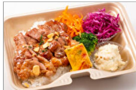
トンテキの彩り弁当