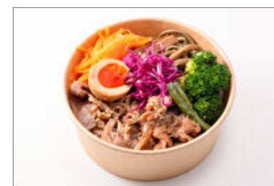
プルコギビビンバ弁当