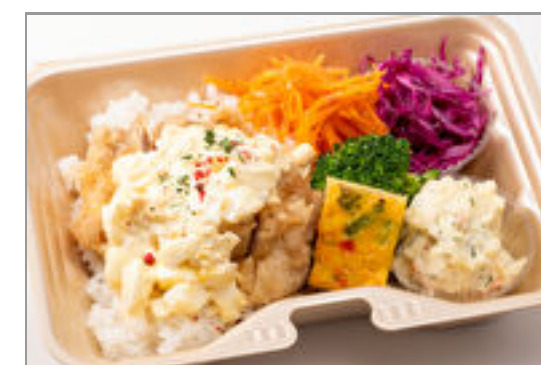
チキン南蛮の彩り弁当