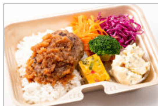
ハンバーグ～おろしソース～の彩り弁当