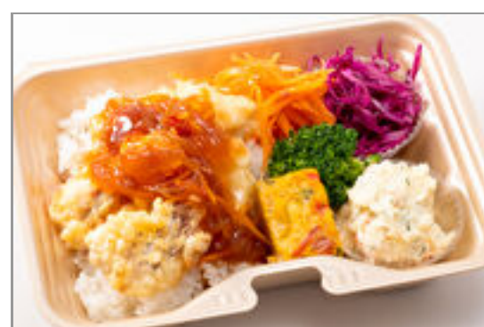
白身魚の餡掛け弁当