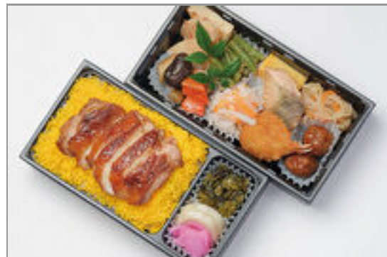
幕内二段重 若鶏の照り焼き 2,000円(税込2,160円)／品番:KNDF028 お茶付き