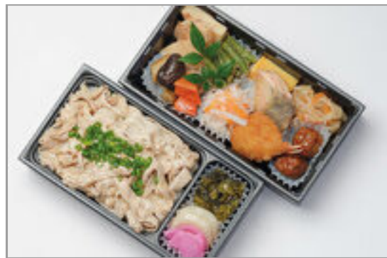
幕内二段重 豚しゃぶの柚子胡椒和え 2,000円(税込2,160円)／品番:KNDF026 お茶付き