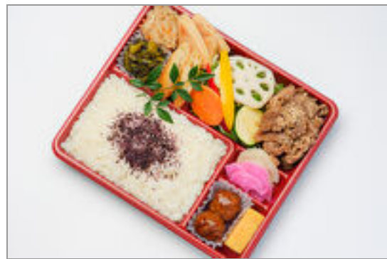
幕の内弁当 牛焼肉 1,760円(税込1,900円)／品番:KNDF007