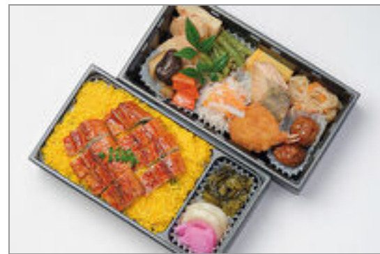
幕内二段重 うなぎ 2,593円(税込2,800円)／品番:KNDF027 お茶付き