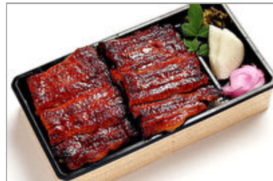
うな重 特上 2,778円(税込3,000円)／品番:KNDF034 お茶付き