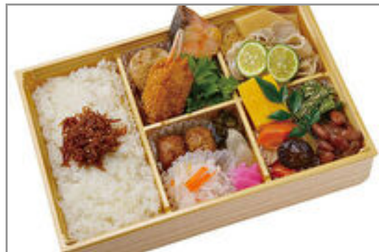
特撰 幕内膳 豚しゃぶの柚子胡椒和え 2,223円(税込2,400円)／品番:KNDF031 お茶付き