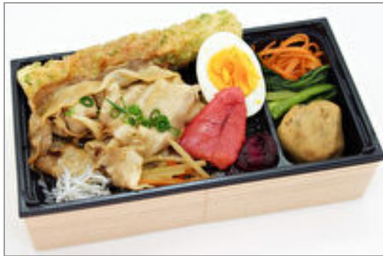
【贅沢なのり弁】豚の生姜 焼き 1,000円(税込1,080円)／品番:FUFJ010