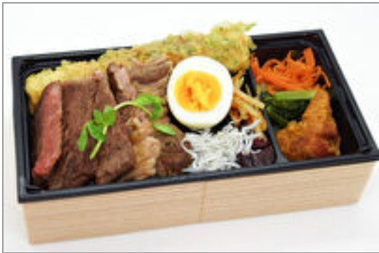
【贅沢なのり弁】肩ロース ステーキ 1,556円(税込1,680円)／品番:FUFJ012