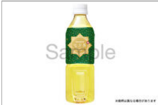
緑茶(500ml ペット ボトル) 149円(税込160円)／品番:FUFJ801