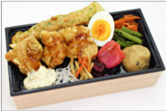
【贅沢なのり弁】チキン南 蛮 1,000円(税込1,080円)／品番:FUFJ011