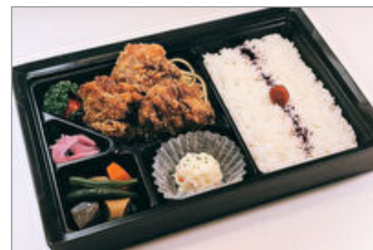
特大鶏唐揚げ弁当(手羽先味)