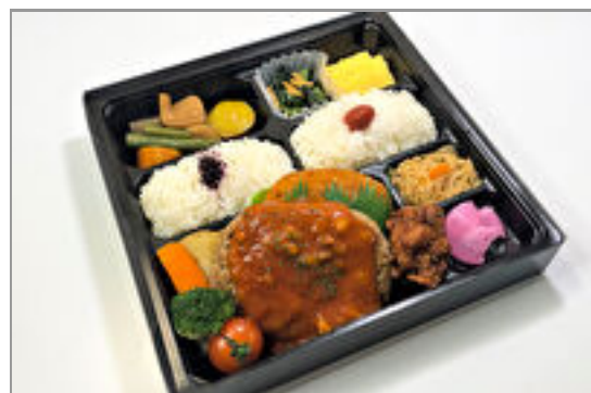
ハンバーグミックス弁当