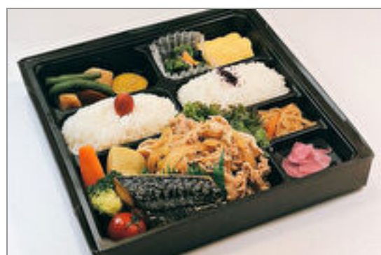
鯖塩焼きと豚生姜焼き弁当