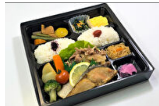
焼きサーモンと豚の生姜焼き弁当