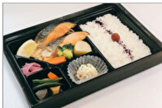
焼きサーモン弁当