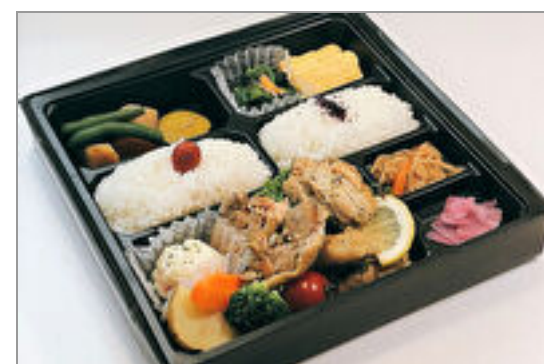
チキンソテー弁当