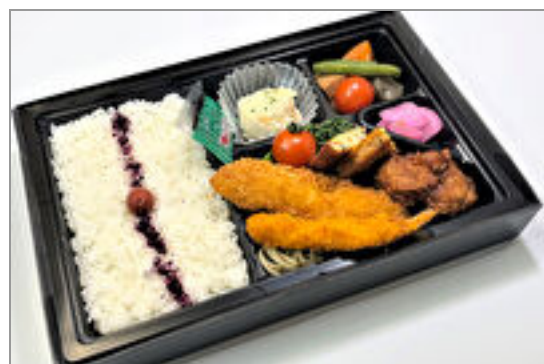
ミックスフライ弁当