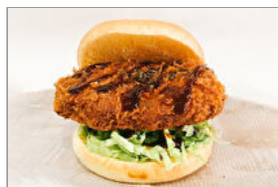
トンカツバーガー