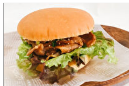
豚生姜焼きバーガー