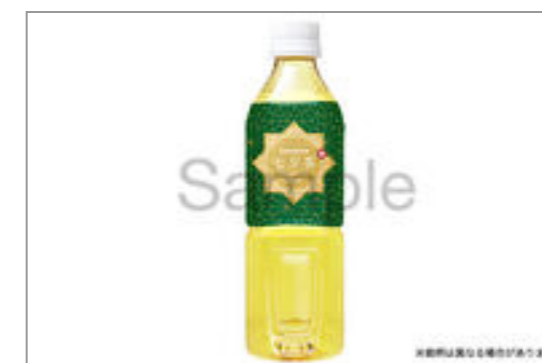
緑茶(500ml ペットボトル)