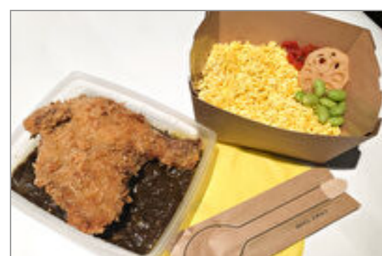
ミックススパイスの骨付きチキンカツカレー