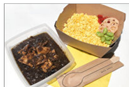
濃厚チキンカレー