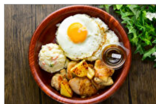
ポテサラ+ガーリックチキン 目玉焼きのせ