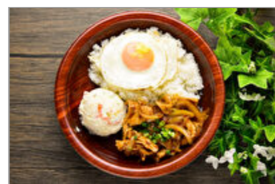
ポテサラ+生姜焼き 目玉 焼きのせ