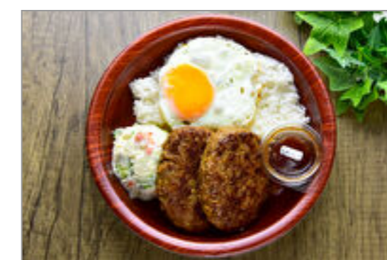
ポテサラ+ハンバーグ和風 ソース目玉焼きのせ