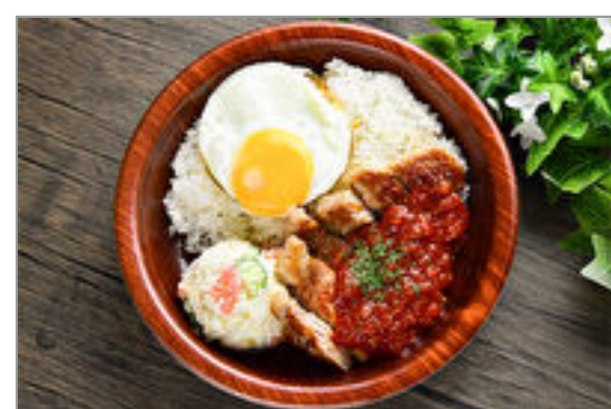
ポテサラ+三元豚ステーキ トマトソースがけ目玉焼のせ

商品によっては、注文条件やオプション・サービス等がございますので、詳しくは WEB でご確認ください。