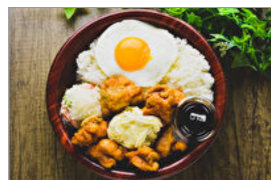
ポテサラ+チキン南蛮タル タルソース目玉焼きのせ