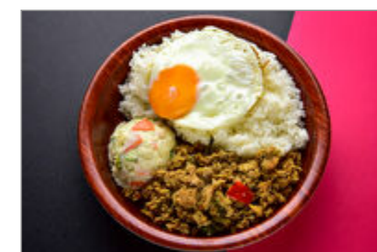
ポテサラ+ガパオライス目 玉焼きのせ