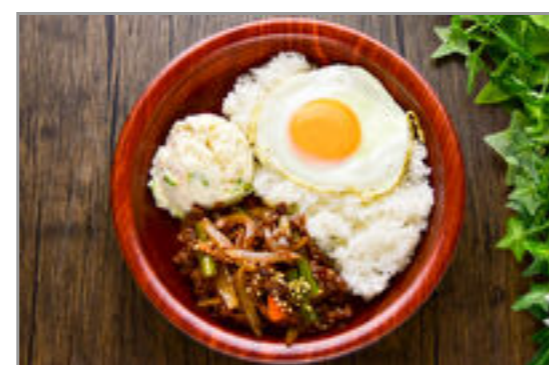
ポテサラ+牛肉プルコギ目 玉焼きのせ