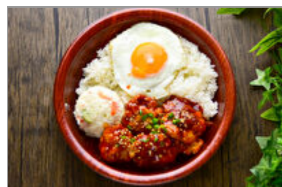
ポテサラ+ヤニヨムチキン 目玉焼きのせ