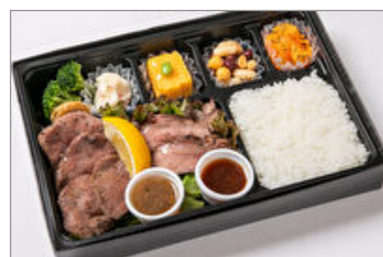
牛たん&交雑牛サーロイン ステーキ