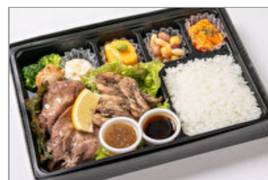
牛たん&地鶏のせせり