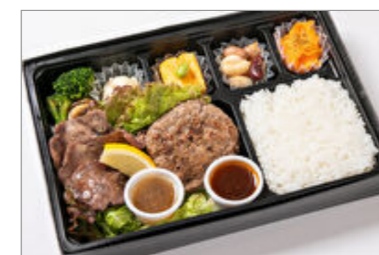
牛たん&和牛ハンバーグ