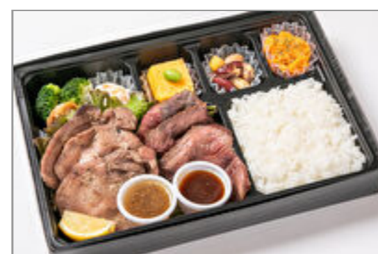
牛たん&交雑牛厳選イチゴ