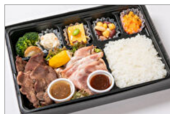
牛たん&香り豚のロースト ポーク

商品によっては、注文条件やオプション・サービス等がございますので、詳しくは WEB でご確認ください。