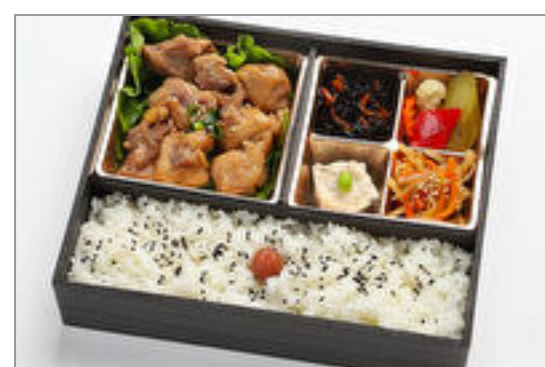
チキン照り焼き弁当

商品によっては、注文条件やオプション・サービス等がございますので、詳しくは WEB でご確認ください。