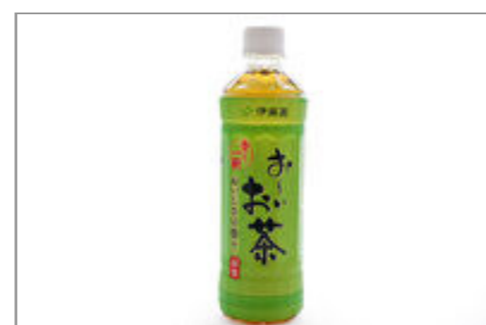
お〜いお茶(500ml ペットボトル) 139円(税込150円) / 品番:CKCC801