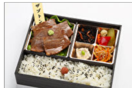
黒毛和牛希少部位弁当 2,000円(税込2,160円) / 品番:CKCC013