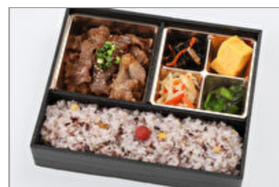
雑穀米ヘルシー和牛弁当