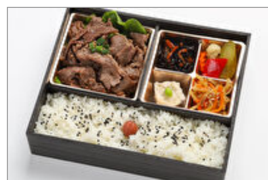
黒毛和牛焼肉弁当