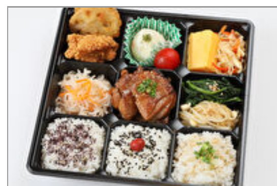
大和華やか弁当<梅>