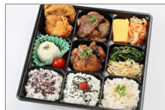
大和華やか弁当<竹>