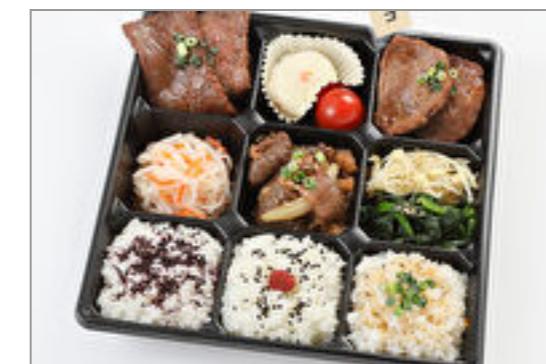
黒毛和牛2種の希少部位和膳 2,500円(税込2,700円) / 品番:CKCC019