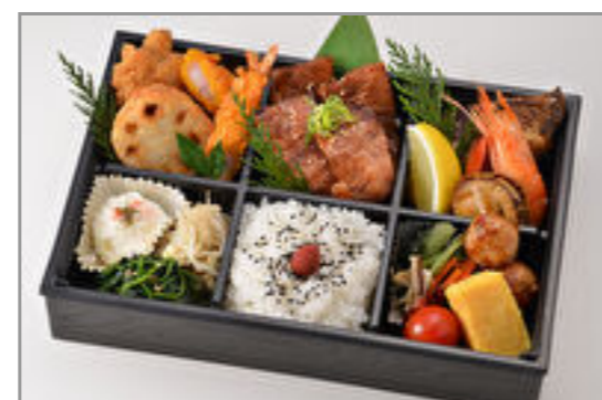
伊万里 3,000円(税込3,240円) / 品番:CKCC016