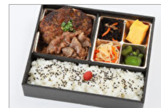
肉屋の極ハンバーグと黒毛和牛焼肉コンビ弁当