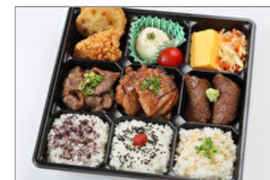
大和華やか弁当<松>