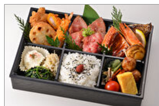
雲仙 4,000円(税込4,320円) / 品番:CKCC018