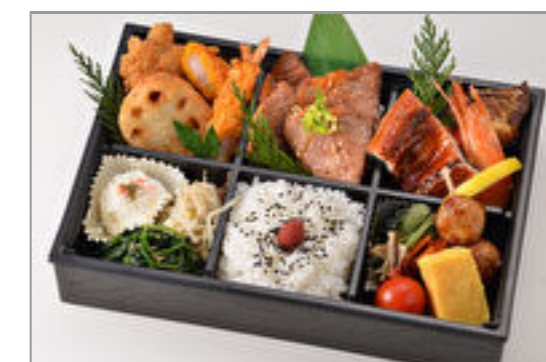
出雲 3,500円(税込3,780円) / 品番:CKCC017