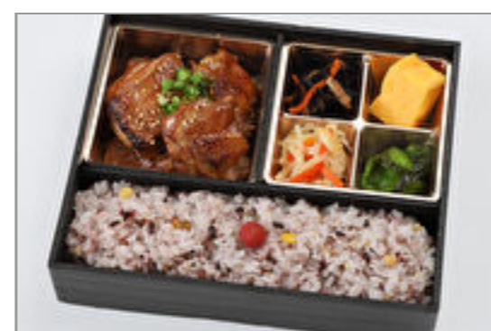
雑穀米ヘルシー鶏弁当