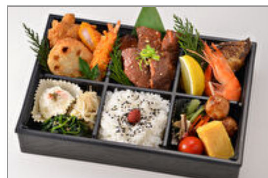
天草 2,500円(税込2,700円) / 品番:CKCC015