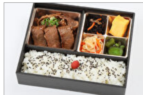
黒毛和牛盛り合わせ弁当 2,000円(税込2,160円) / 品番:CKCC012