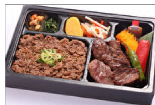
黒毛和牛上焼肉とすき焼き重弁当◆eco容器