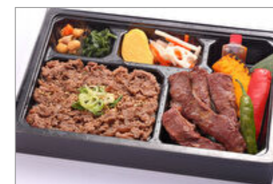
はらみ焼肉とすき焼き重弁当◆eco容器