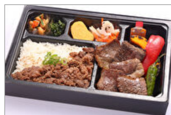
和牛カルビ焼肉とすき焼き重弁当◆eco容器

商品によっては、注文条件やオプション・サービス等がございますので、詳しくはWEBでご確認ください。