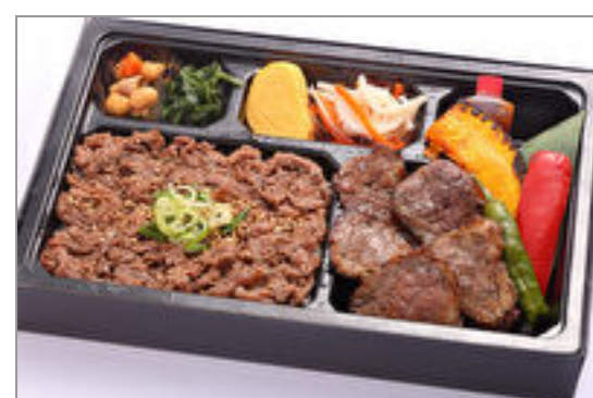
神戸牛上焼肉と神戸牛すき焼き重弁当◆eco容器