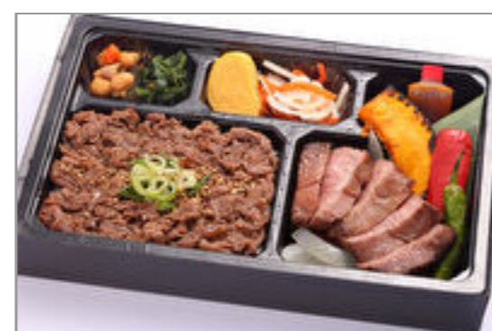
神戸牛霜降ステーキと神戸牛すき焼き重弁当◆eco容器