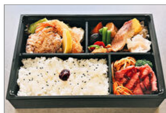
特選ささ川幕ノ内