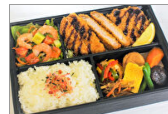
麓山高原豚ロースかつとアポカドシュリンプ膳