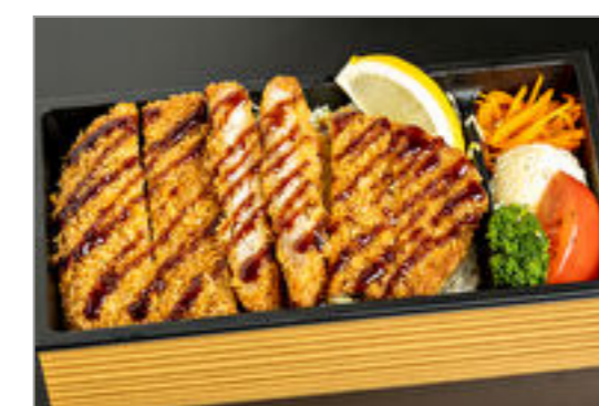
麓山高原豚ロースかつ重