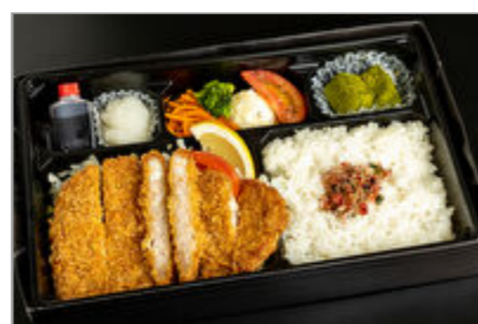
麓山高原豚ロースかつ膳