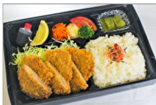
麓山高原豚ヒレかつ膳