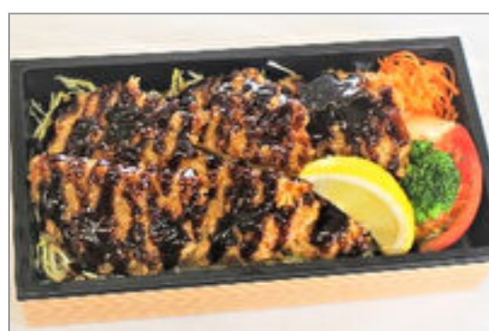
麓山高原豚ヒレかつ重