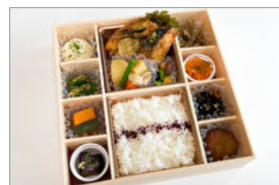
さばの竜田揚げ御膳

商品によっては、注文条件やオプション・サービス等がございますので、詳しくは WEB でご確認ください。