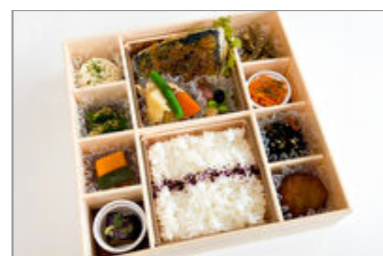
さわらの西京焼き御膳