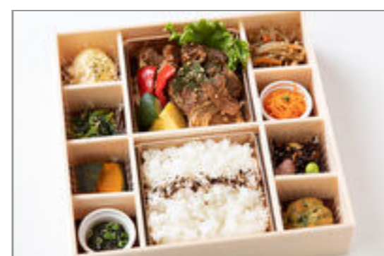
牛カルビ焼き肉御膳