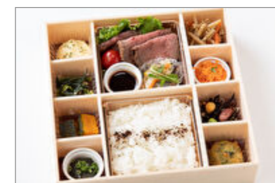
特製ローストビーフ御膳