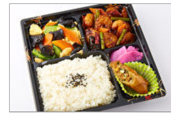
きくらげ玉子炒め&海老のピリ辛炒め御膳 1,389円(税込1,500円) / 品番:TOCH006 お茶付き