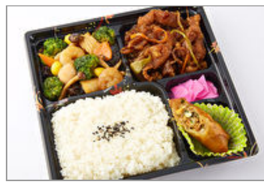
八宝菜&酢豚御膳 1,389円(税込1,500円) / 品番:TOCH005 お茶付き