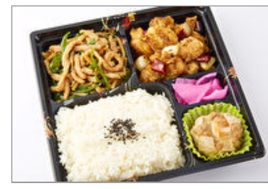
青椒肉絲&四川鶏炒め御膳 1,389円(税込1,500円) / 品番:TOCH004 お茶付き