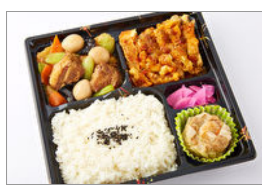
角煮&油淋鶏御膳 1,389円(税込1,500円) / 品番:TOCH002 お茶付き