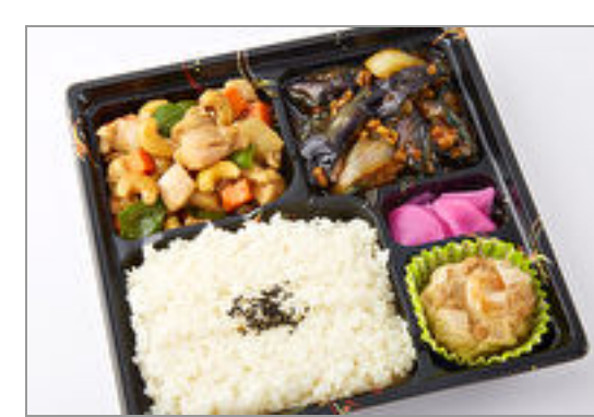
鶏肉のカシューナッツ炒め & 麻婆茄子御膳 1,389円(税込1,500円) / 品番:TOCH001 お茶付き

腹ペコさんの味方「美味しい屋」からリッチな中華弁当が登場!ボリューム感はそのままだに質にこだわった味をお楽しみください。