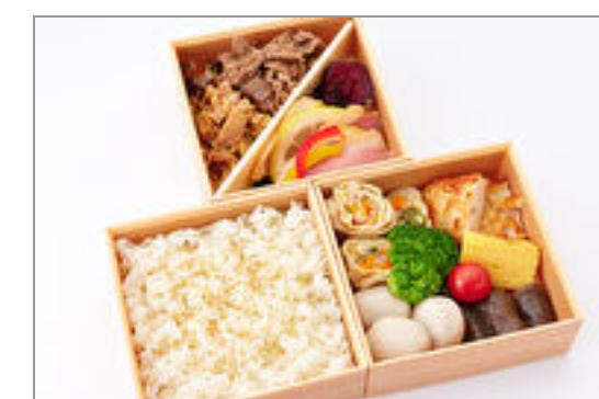
厳選和牛・軍鶏すき焼き盛り三段弁当