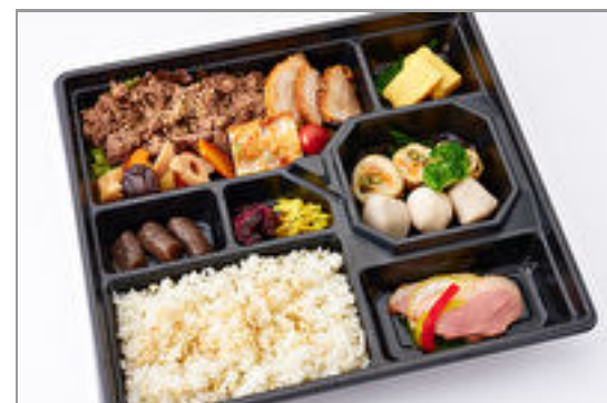
匠技! 厳選和牛炙り焼き ・軍鶏焼合盛弁当