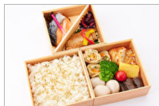
季節の魚・軍鶏焼合盛り三段弁当