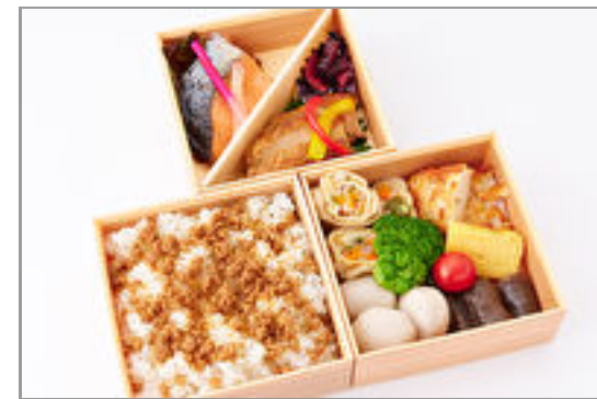
選べるごはんde季節の魚 ・軍鶏焼合盛り三段弁当