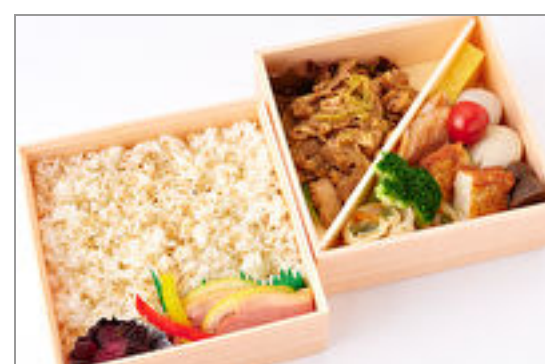
季節の魚・軍鶏すき焼き盛り二段弁当

商品によっては、注文条件やオプション・サービス等がございますので、詳しくはWEBでご確認ください。