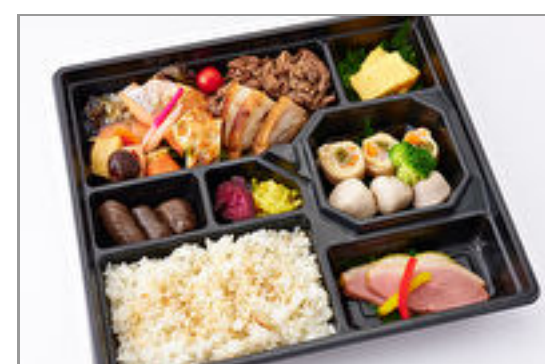
選べるごはんde黄金弁当