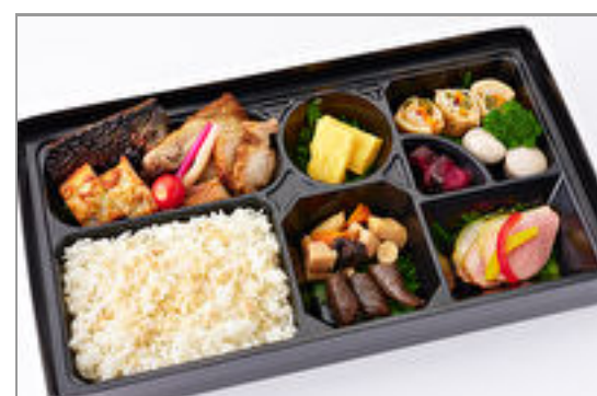
匠技! 季節の魚味噌漬焼弁当