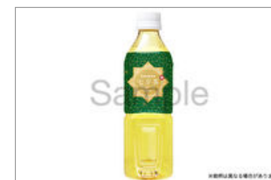
緑茶(500ml ペット ボトル)