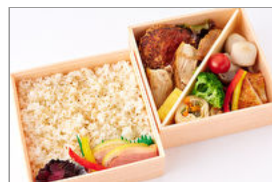
厳選和牛ハンバーグ・軍鶏焼合盛り二段弁当