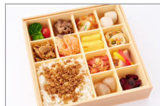
選べるごはんde満開弁当