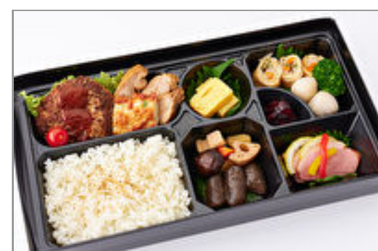
匠技! 厳選和牛ハンバーグ弁当