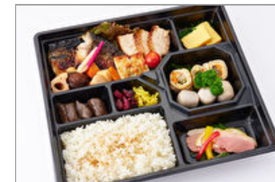
匠技! 季節の魚味噌漬・ 軍鶏焼合盛弁当