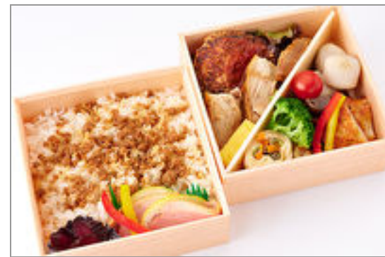
選べるごはんde厳選和牛 ハンバーグ・軍鶏焼合盛二 段弁当