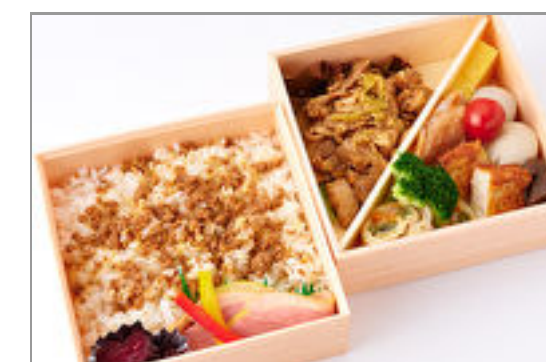
選べるごはんde季節の魚・軍鶏すき焼き盛り二段弁当