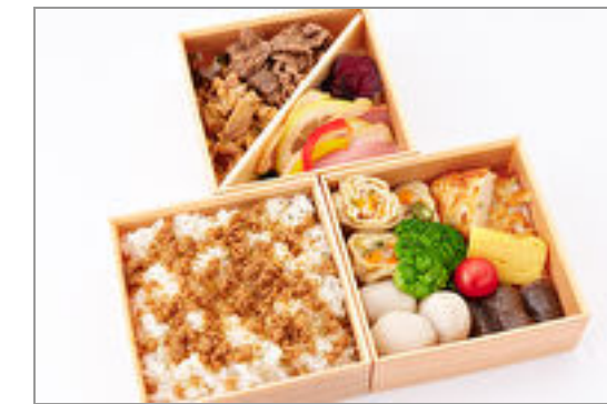
選べるごはんde厳選和牛 ・軍鶏すき焼合盛り三段弁 当