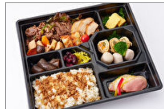
匠技! 厳選和牛すき焼き ・軍鶏焼合盛弁当