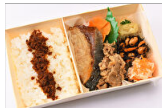
国産ぶりの塩焼きと国産牛焼肉のWメイン弁当～手作り鰹ふりかけ付き～ 1,500円(税込1,620円)／品番:SFMW065 お茶付き