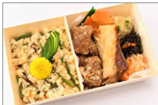
国産ぶりの塩焼きとマグロの唐揚 げのWメイン弁当～こだわり出汁 で炊いた季節の炊き込みご飯～ 1,575円(税込1,700円)／品番:SFMW060 お茶付き