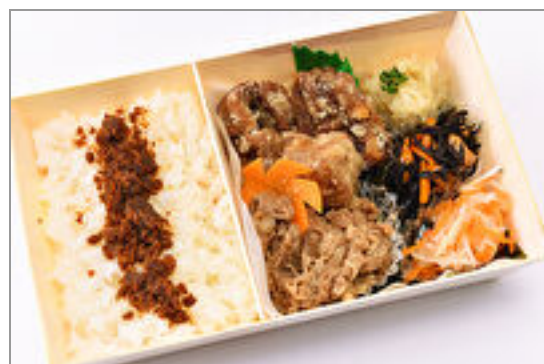
マグロの唐揚げと国産牛焼肉のW メイン弁当～手作り鰹ふりかけ付 き～ 1,500円(税込1,620円)／品番:SFMW061 お茶付き