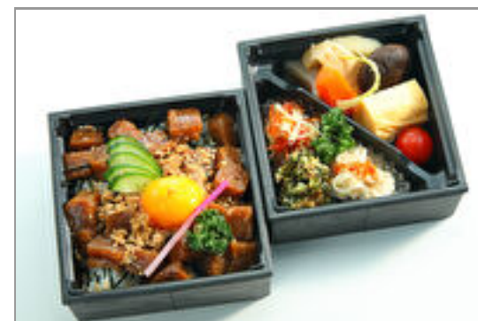
彩り二段御膳～マグロユッケ～ 2,000円(税込2,160円)／品番:SFMW071 お茶付き