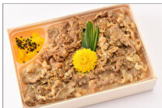
国産牛しぐれ煮弁当 1,000円(税込1,080円)／品番:SFMW052