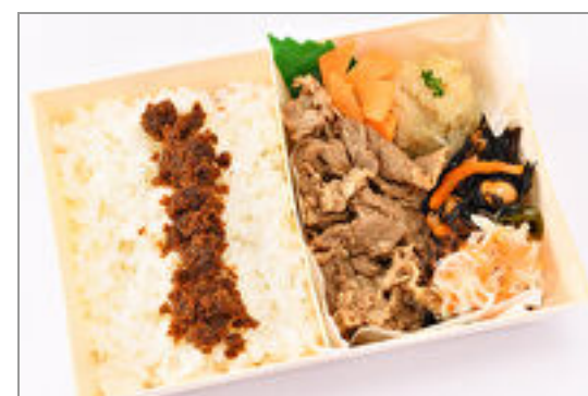
国産牛の焼肉弁当～手作り鰹ふりかけ付き～ 1,000円(税込1,080円)／品番:SFMW059