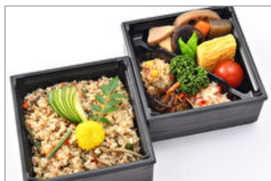
彩り二段御膳～国産牛肉入 り季節の炊き込みご飯～ 1,000円(税込1,080円)／品番:SFMW068