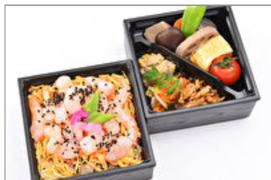
【熨斗対応可】彩り二段重 ～えびちらし～ 1,500円(税込1,620円)／品番:SFMW028 お茶付き