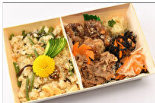
マグロの唐揚げと国産牛焼肉のW メイン弁当～こだわり出汁で炊い た季節の炊き込みご飯～ 1,575円(税込1,700円)／品番:SFMW062 お茶付き