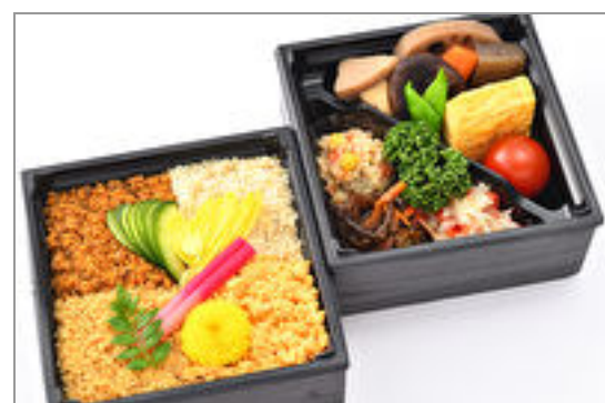
彩り二段御膳～4色そぼろ ご飯～ 1,000円(税込1,080円)／品番:SFMW034