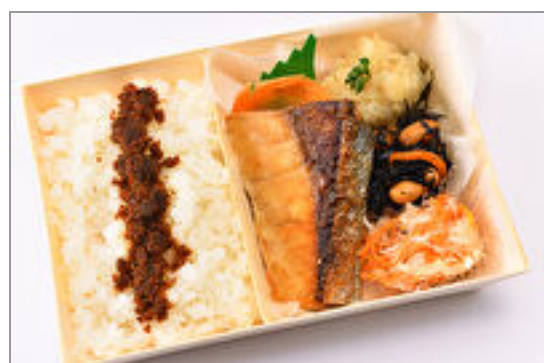
ふっくら国産ぶりの塩焼き弁当～手作り鰹ふりかけ付き～ 1,000円(税込1,080円)／品番:SFMW055