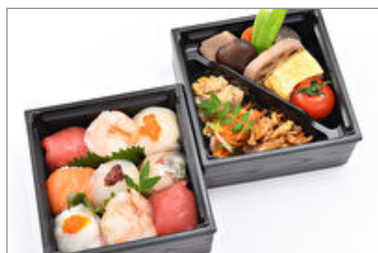
【熨斗対応可】彩り二段御膳～手まり寿司～ 2,000円(税込2,160円)／品番:SFMW032 お茶付き