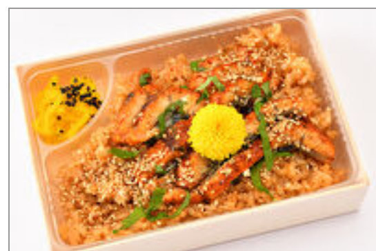
こい希自慢のひつまぶし弁 当 1,000円(税込1,080円)／品番:SFMW051