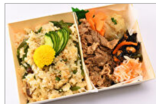
国産牛の焼肉弁当～こだわり出汁で炊いた季節の炊き込みご飯～ 1,000円(税込1,080円)／品番:SFMW058