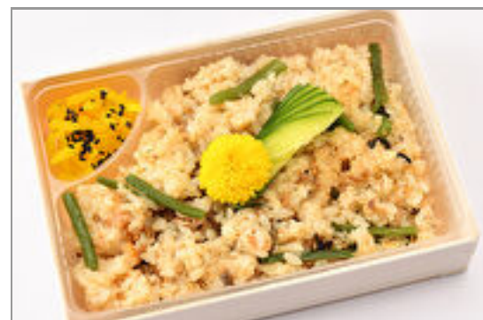
こい希特製 季節の炊き込 みご飯弁当 800円(税込864円)／品番:SFMW067