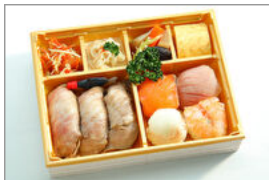
【熨斗対応可】こい希特製彩り御膳～希少部位の肉寿司と手まり寿司～ 2,000円(税込2,160円)／品番:SFMW070 お茶付き