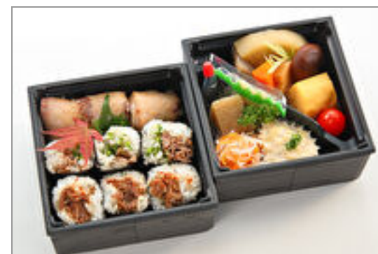
こい希特製彩り御膳～希少部位の肉寿司と和牛肉巻き寿司～ 2,500円(税込2,700円)／品番:SFMW081 お茶付き