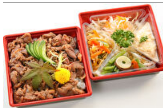
とろける黒毛和牛牛めし御膳 2,500円(税込2,700円)／品番:SFMW082 お茶付き