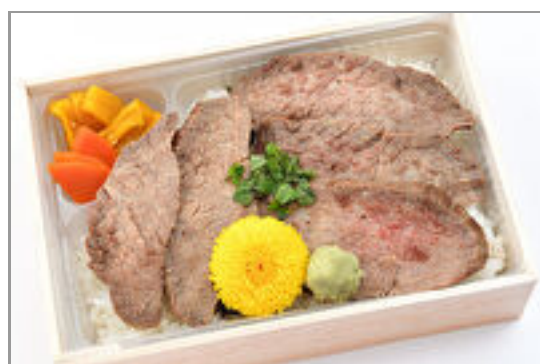
厳選牛のローストビーフ重 1,500円(税込1,620円)／品番:SFMW069 お茶付き