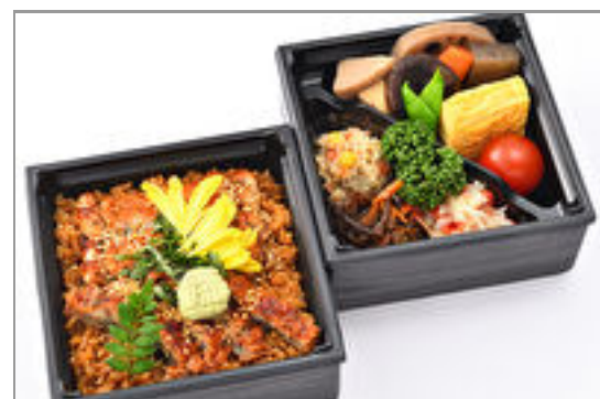
彩り二段御膳～うなぎのひ つまぶし～ 1,500円(税込1,620円)／品番:SFMW035 お茶付き