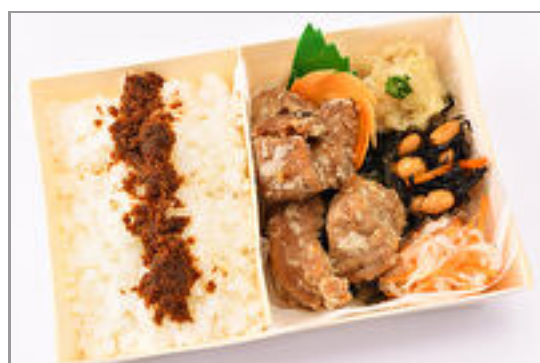
米油で揚げたマグロの唐揚げ弁当～手作り鰹ふりかけ付き～ 1,000円(税込1,080円)／品番:SFMW057