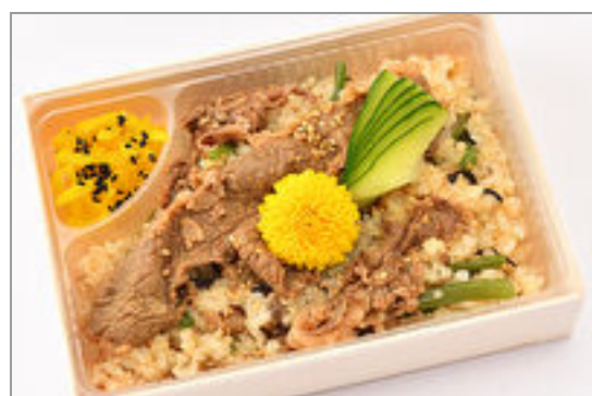
こい希特製 季節の炊き 込みご飯～国産牛肉入り～ 1,000円(税込1,080円)／品番:SFMW053