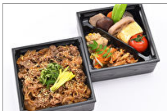
彩り二段御膳～牛肉しぐれ 煮～ 1,500円(税込1,620円)／品番:SFMW026 お茶付き