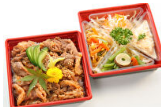
とろける国産牛めし御膳 2,000円(税込2,160円)／品番:SFMW079 お茶付き