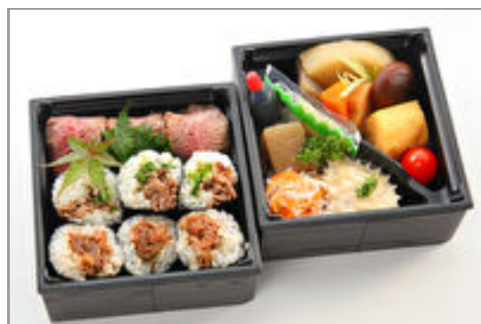
こい希特製彩り御膳～和牛ローストビーフの肉寿司と肉巻き寿司～ 2,000円(税込2,160円)／品番:SFMW080 お茶付き