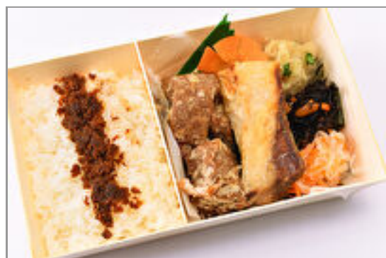
国産ぶりの塩焼きとマグロの唐揚 げのWメイン弁当～手作り鰹ふり かけ付き～ 1,500円(税込1,620円)／品番:SFMW063 お茶付き