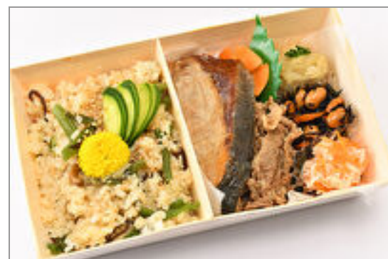
国産ぶりの塩焼きと国産牛焼肉の Wメイン弁当～こだわり出汁で炊 いた季節の炊き込みご飯～ 1,575円(税込1,700円)／品番:SFMW064 お茶付き