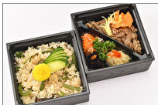
国産牛の彩り二段御膳～季 節の炊き込みご飯～ 1,000円(税込1,080円)／品番:SFMW066