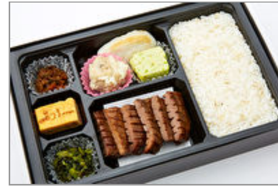
手焼き厚切牛たん幕の内弁当