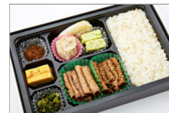
牛たん食べ比べ幕の内弁当