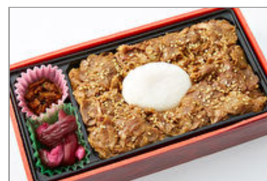
牛たんまかない弁当