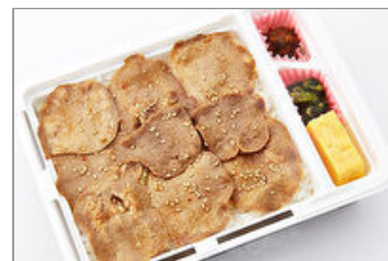
【温まる】牛たん丼 たれ味