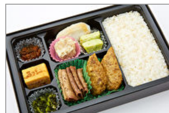
牛たん幕の内弁当