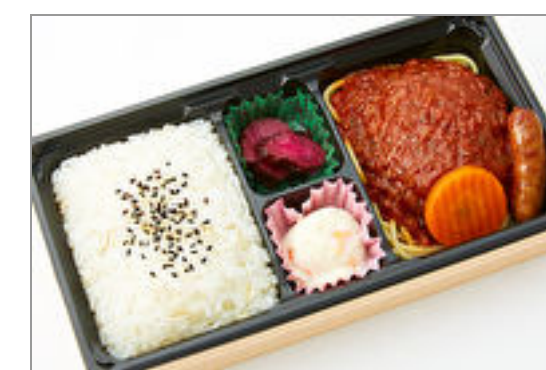
牛たんトマトハンバーグ弁当