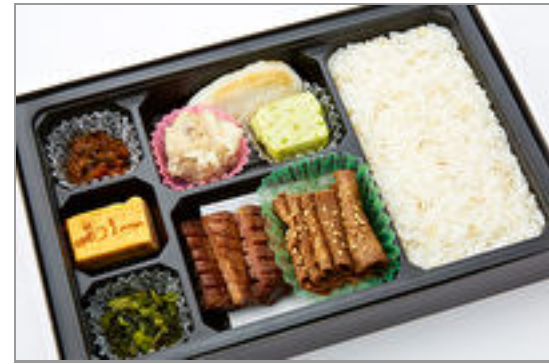
厚切り牛たんと薄切り牛たん食べ比べ幕の内弁当