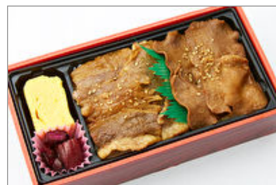
牛たん牛カルビ焼肉弁当