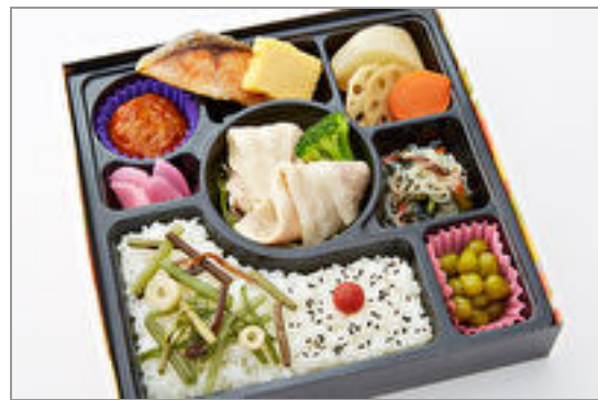
煎り胡麻 豚しゃぶ幕の内御膳