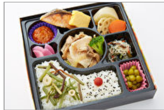
特選豚塩だれ炒め幕の内御膳